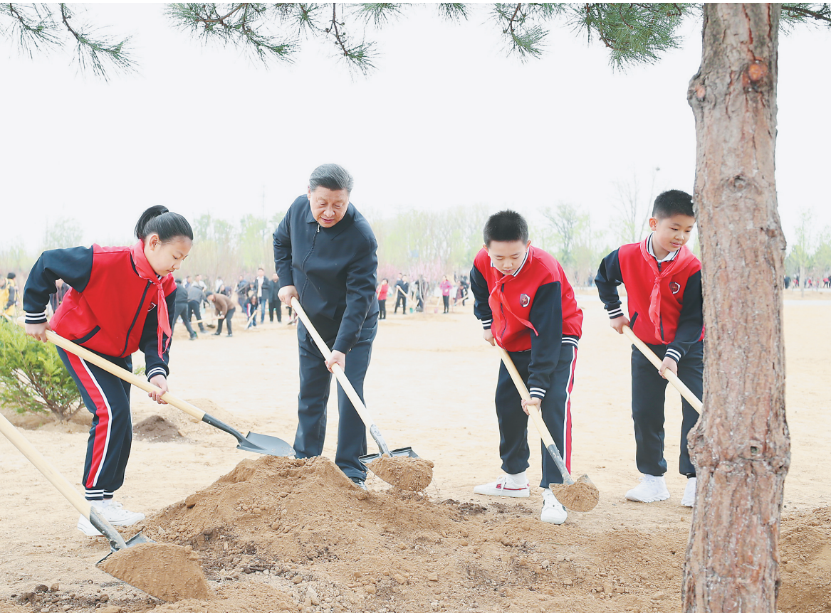
4月2日,党和国家领导人习近平、李克强、栗战书、汪洋、王沪宁、赵乐际、韩正、王岐山等来到北京市朝阳区温榆河参加首都义务植树活动。这是习近平同大家一起植树。

习近平指出,生态文明建设是新时代中国特色社会主义的一个重要特征。加强生态文明建设,是贯彻新发展理念、推动经济社会高质量发展的必然要求,也是人民群众追求高品质生活的共识和呼声。中华民族历来讲求人与自然和谐发展,中华文明积累了丰富的生态文明思想。新发展阶段对生态文明建设提出了更高要求,必须