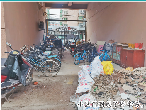
小区门洞成了停车场。