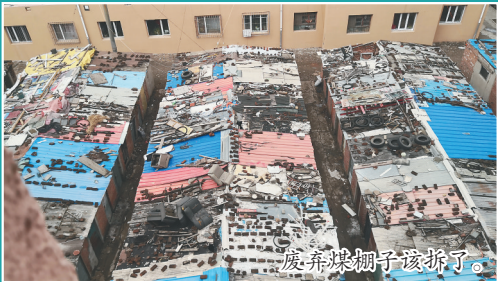
废弃煤棚子该拆了。