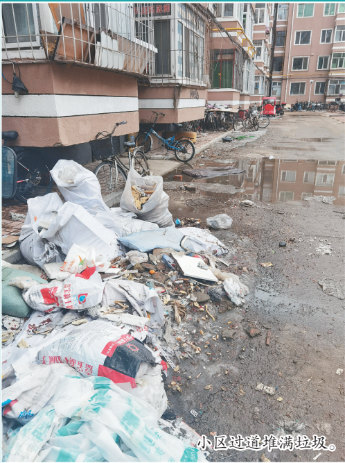
小区过道堆满垃圾。

从去年开始,牡丹江市进行了环境综合治理,街区面貌焕然一新。开春以来,一些老旧小区居民却有了担忧,垃圾有向内延伸的趋势。3月28日、29日,记者对一些小区进行走访,看到残雪、垃圾、乱堆乱放问题,确实普遍存在。