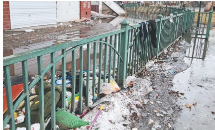
垃圾堆得到处都是。

周边居民说,虽然距离何家沟只有十几米远,但是由于没有配备相应的排水管线,春季积雪融化或是夏天降雨都会在这里积成大片的水洼。不仅影响人们的通行,还会滋生蚊虫,严重影响居民们的正常生活。