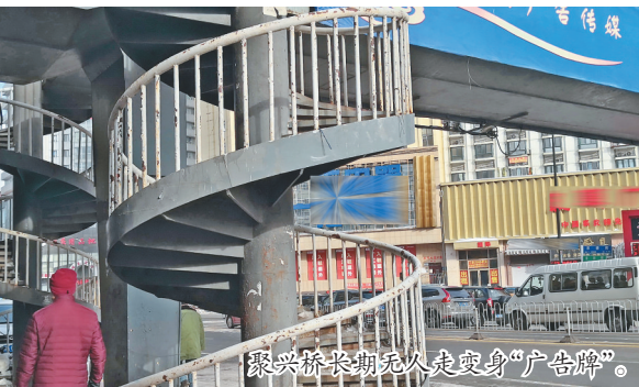
聚兴桥长期无人走变身“广告牌”。