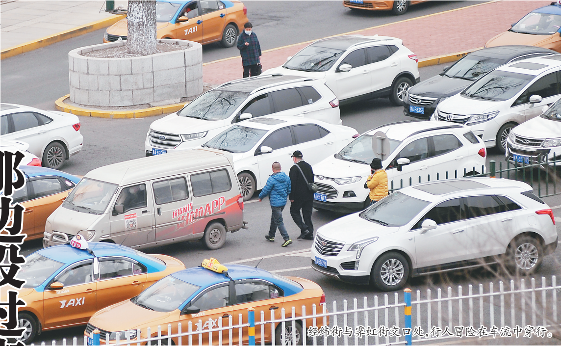
经纬街与霁虹街交口处,行人冒险在车流中穿行。