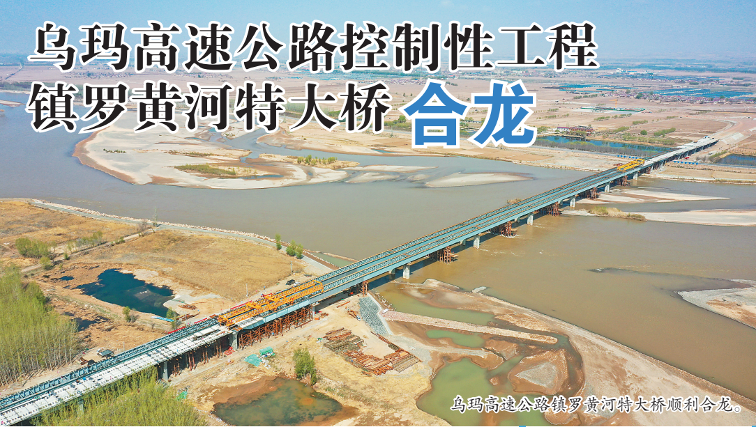
乌玛高速公路镇罗黄河特大桥顺利合龙。