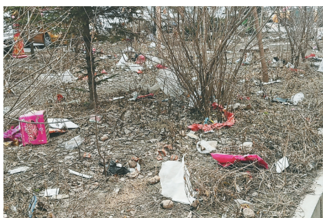
小区环境脏乱令业主不满。

另外一位居民表示,如果是长期恶意拖欠自来水费,给居民家停水是正常的。但作为物业企业,是谁赋予了可以采取停水措施的权利?如果欠费,物业可以用法律的手段正常维权,而不是采用这种极端的方式来解决。