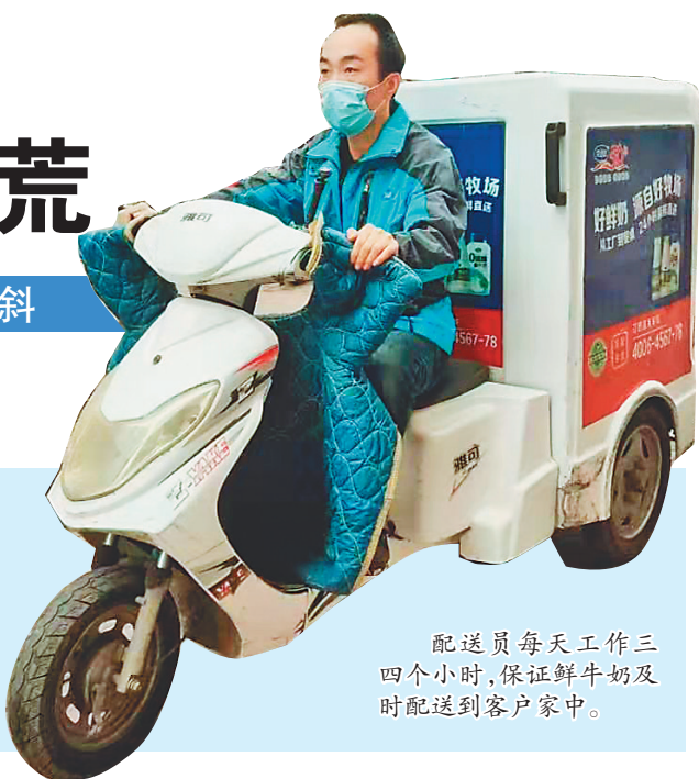
配送员每天工作三四个小时,保证鲜牛奶及时配送到客户家中。

张天刚建议,乳品企业积极应对配送员紧缺现状,设计有较强吸引力和激励机制的薪酬结构,收入待遇向基层岗位倾斜;加强配送员队伍的业务素质培养、技能培养,纳入职能岗位序列,做好职业规划,打通成长路径,摒弃边缘性岗位思想;让专业的人干专业的事,寻求专门的服务机构,剥离配送职能由这些机构经营和服务;健全配送员的劳动保障机制,建立劳动风险防范机制,解决其后顾之忧,增强职业尊严;做好文化融合工作,因配送员入职门槛低,人员的知识水平较低,做好基层员工的思想文化建设,倾听他们的心声,解决他们的呼声,将他们的所思所想纳入到企业决策层考虑的层面。这些措施并非短期内能够实现的,但通过这些举措,最终可以完善配送员队伍建设,将企业的产品文化、产品价值观输送到供给端,从而带动企业服务质量的良性循环。