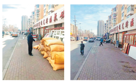
执法人员现场执法。 恢复整洁的人行道。

下一步,香坊区城管执法人员将采取全天候不间断巡查,专人定点管控相结合的模式,持续对此处进行严格管控,防止占道加工扰民的行为。