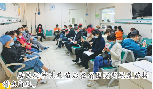
居民接种完疫苗后在省医院新冠疫苗接种点留观。