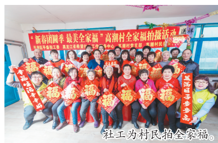
社工为村民拍全家福。

□调查记者 莫丽萍 作为记者，应坚持“每事问”，眼睛向下，脚步向下，探求真实，求解问题，守正创新。 我的新闻热线： 15636158767