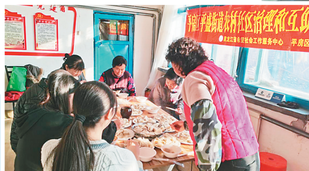
每年冬至，希望社工组织村民一起包饺子。