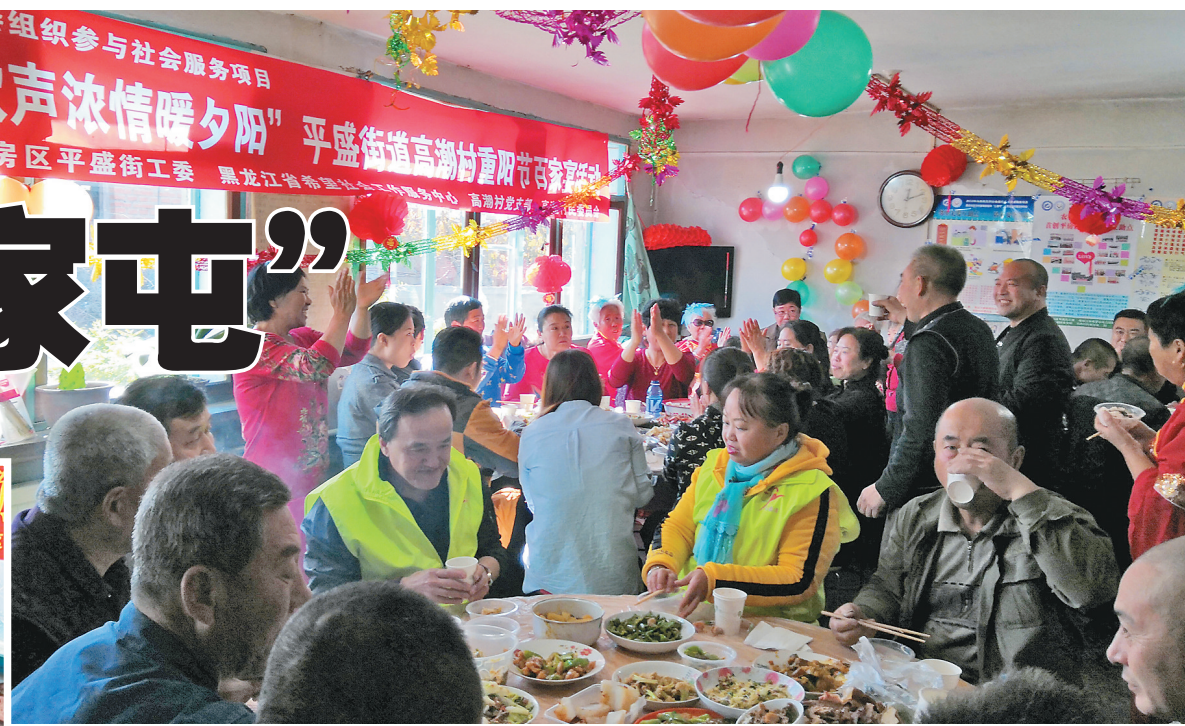
高潮村举办重阳节百家宴。