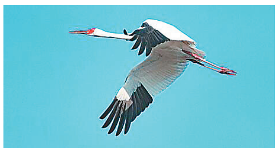
白鹤在蓝天展翅高飞。

日前,两只丹顶鹤静卧在林甸育苇场芦苇荡内,一个多小时后,丹顶鹤外出“兜风”。记者通过航拍器发现,一个丹顶鹤窝里有两枚大大的鹤蛋!