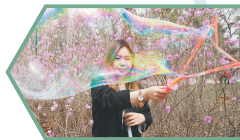
市民在杜鹃花前嬉戏。

据了解,自党史学习教育启动以来,省林草局积极开展“我为群众办实事”实践活动,免费开放省森林植物园是省林草局开展“我为群众办实事”的举措之一。为方便百姓到“天然氧吧”游玩,省林草局多方筹措资金,维修多项基础设施,大力改善园区软硬件条件。