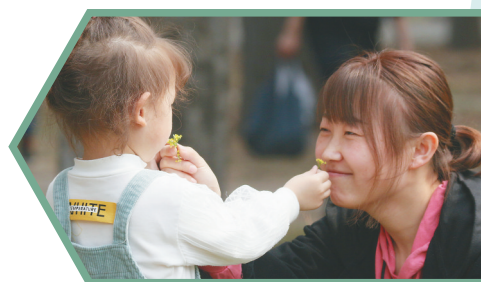
市民在植物园赏花。