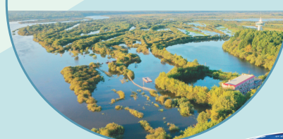
挠力河国家级湿地自然保护区。

■以国家公园为主体的自然保护地体系加快建立,国家公园体制试点工作在理顺管理体制、加强生态保护修复等方面取得阶段性成果。