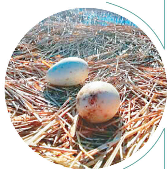
航拍器发现并拍摄到丹顶鹤巢、蛋。