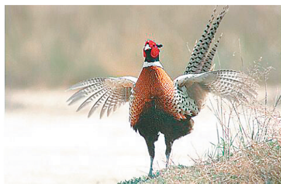
一只雉鸡在杜尔伯特连环湖畔沐浴春光。