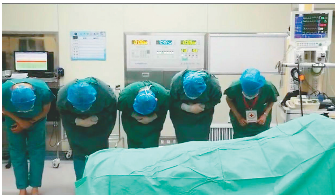
医护人员向器官捐献者鞠躬致哀。

“虽然目前角膜捐献呈逐年递增的形势,但我省每年有大约5万人因各种角膜疾病需要角膜移植,并且这样的患者正在以每年5000人左右的速度递增,角膜捐献的数量还远远不足。”张弘说,过去一枚眼角膜只能移植给一名患者,如今随着医学技术的进步,通过成分角膜移植,一枚眼角膜最多可以为3名眼疾患者送去光明。“我们呼吁更多的爱心人士加入到角膜捐献的队伍中来,将爱与光明传递下去。”