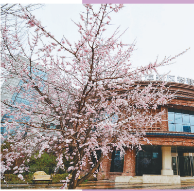
满城春花美不胜收。

冬季,儿童公园、湘江公园、斯大林公园等全市11座公园在保障公园甬道、广场等通行活动功能积雪清根见底的同时,在绿地花坛等非使用功能区域划定“景观留白区”,让银装素裹的北国风光在冰城公园里盛装绽放……冰灯与雪韵联袂相映,构成了哈尔滨城市公园全国独树一帜的冬季特色景观。