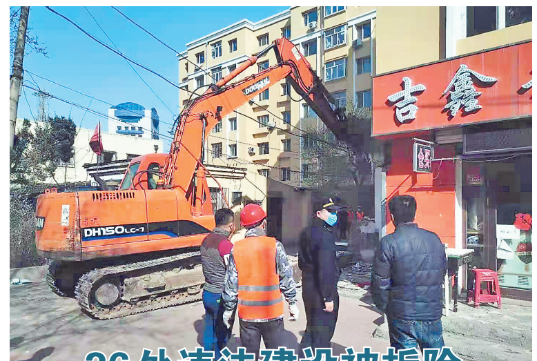
26处违法建设被拆除

本报讯(吴昌林 记者刘莉)26日,哈尔滨市香坊区综合行政执法局联合香坊大街街道办事处等相关部门将位于香吉街、香坊大街等地的26处近400平方米违法建设依法拆除。