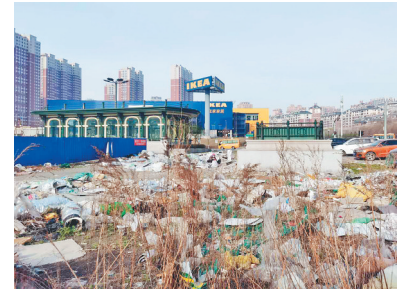
复旦路旁堆放的垃圾带。

27日,哈尔滨市城市管理局立即责成南岗区城管局解决。28日,据南岗区城管局工作人员反馈,27日下午他们组织20余人对该处垃圾进行集中清理,并于17时将垃圾全部清理完毕。28日上午,记者再次来到此处,看到此处的垃圾已被清理干净。