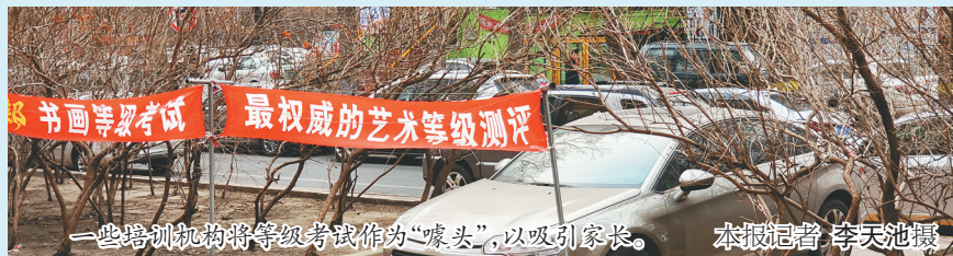
一些培训机构将等级考试作为“噱头”,以吸引家长。

采访中,记者发现,最初孩子偶尔表现出对某种特长特别感兴趣,家长则马上报班学习;一段时间后,家长在“不考级”就白学了的心理作用下,开始督促孩子不断向上考级考证,渐渐地,孩子感兴趣的特长变成了负担。在应试化的培训完成考级后,很多孩子便失去了兴趣,甚至出现逆反心理。