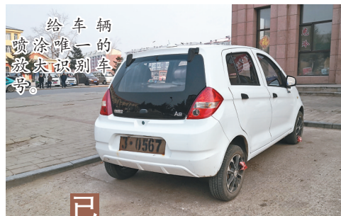
给车辆 喷涂唯一的 放大识别车 号。

一位驾驶人告诉记者,这种车是办不了机动车落户手续的,但放大号是交警部门给喷的,有放大号就能上路行驶,如果没有放大号,交警就抓。