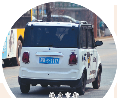
铁力市街 头有许多四轮 电动车。

水处理委托浙江水艺公司运行一年,待各项管理技术运营稳定后,再转交给集体管理。同时将城市新型物业管理理念引入广大农村地区,设立公益岗位,维护乡村公共基础设施运营。对每户每月收取不低于10元的排污费,筹集运营维护资金,实现小毛病自己解决、大故障委托专业人员处理,确保公共设施持久使用。将污水处理过程中的COD、氨氮、总磷、总氮等十项数据连接到区人居环境监测中心,实行24小时在线监控,使污水处理厂排放水质稳定达标。