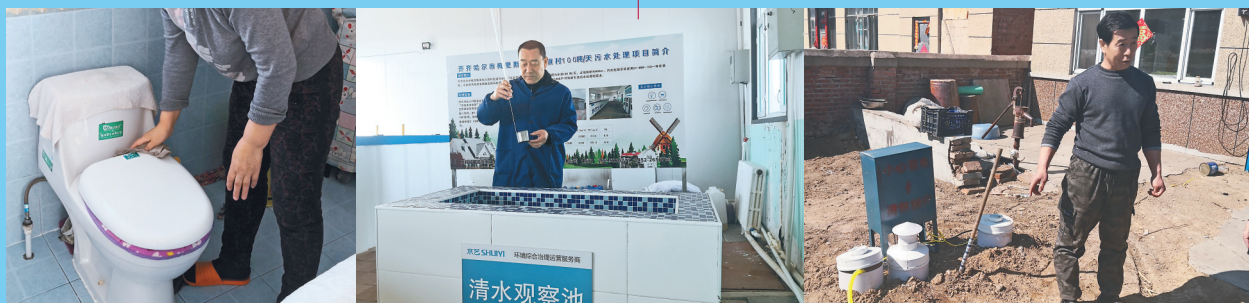
新厕所,农民用着很方便。 村里污水厂内,工作人员在查看水质。 村民家经过处理的污水可以直接浇地。

近日,有读者向本报反映,哈尔滨市道里区友谊路公交首末站房顶有一个钟楼,四面钟表显示的时间不一样,希望相关部门早日修复。4月28日,记者来到现场查看,发现该钟楼上四个方向有四块钟表,其中三块显示正确的时间。第四块钟表的指针和时针却始终指向12点的方向。附近的居民说,这种现象已经持续了一段时间了,希望相关部门早日将其修复,免得有人看错时间耽误事。