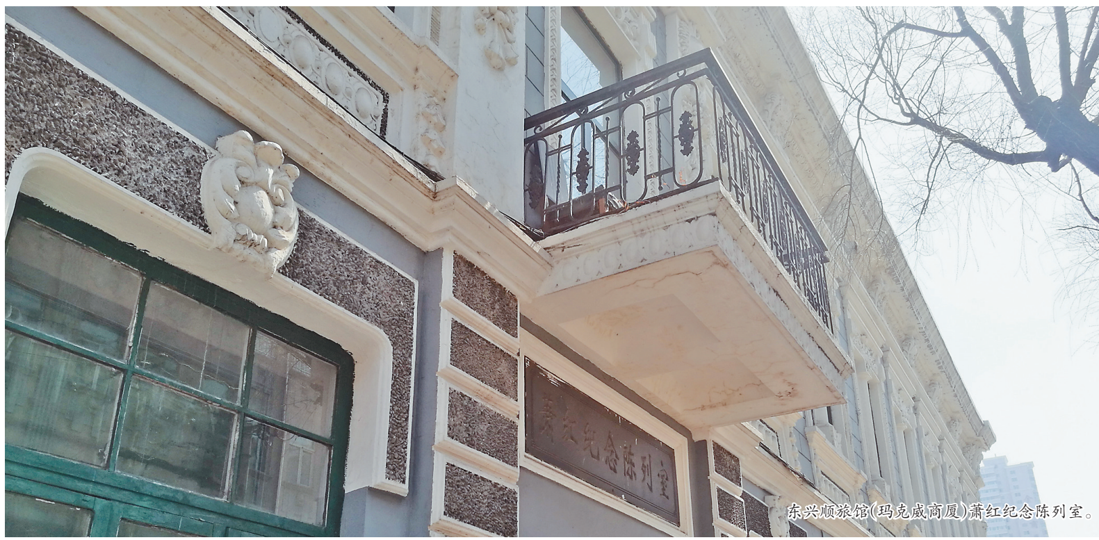
东兴顺旅馆(玛克威商厦)萧红纪念陈列室。

红彤彤的落日又圆又大，就在最远处的那排白杨树上，似乎迎面而来，不是落下去，而是在掉下去。晚风习习，拥抱着草原上的达斡尔人，江奔流，滋养着草原上的达斡尔人。（本稿件图片均为本报资料片。）