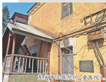
东省市立医院(儿童医院)。

二萧留下的公园照片不止这一张，从服装和体态来看，二萧来公园的次数也不止合影这一次。如果读者有兴趣，可以按照当年的照片把公园走一遍，或者模仿当年的二萧们拍些相似的照片。“他们相依着，前路似乎被蚊虫遮断了，冲穿蚊虫的阵，冲穿大树的林，经过两道桥梁，他们在亭子里坐下，影子相依在栏杆上。”萧红《奔儿》里是这么写这座公园的，但在实际生活中，肯定是既有痛苦的一面，也有高兴的一面，比如刚刚摆脱困境时的萧红，心里肯定也是有几分欢喜的。