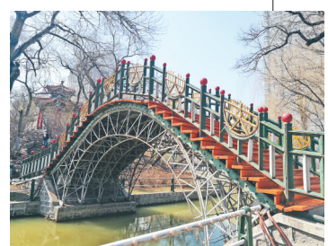
东省公园(兆麟公园)二萧合影桥。