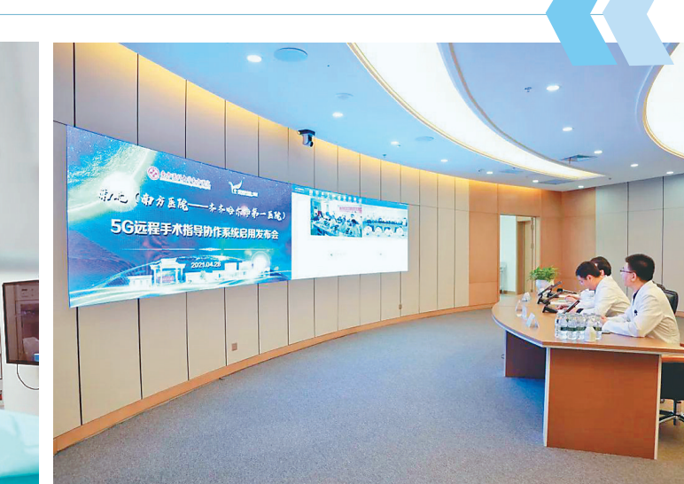
齐齐哈尔第一医院专家和南方医院专家团队远程交流。

本报(关晨光 记者朱彤)近日,南方医院与齐齐哈尔第一医院正式建立南北5G远程手术指导协作系统平台,通过远程MDT会诊、5G远程手术指导等合作,双方团队在消化疾病诊疗的规范化、微创化、同质化方面建立了高水平合作关系,开创了临床诊疗的新模式,实现了南北医疗合作的新突破。 术中,在南方医院消化病团队5G远程指导下,齐齐哈尔第一医院消化病团队在南方医院专家的远程指导下,成功完成了一例腹腔镜下直肠癌根治术。通过5G信息技术,南方医院的专家直接获取齐齐哈尔第一医院主