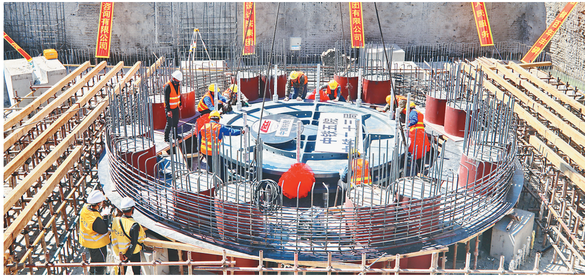
工人们正在进行转体支座安装。

本次主桥转体支座安装施工既是整个桥梁转体系统的核心,又是主桥转体墩施工的控制性工序。转体支座结构直径4.55米、高0.41米、重量35吨,具有结构宽、自重大、安装精度要求高等特点,要求安装后支座顶面相对高差控制在2毫米以内。