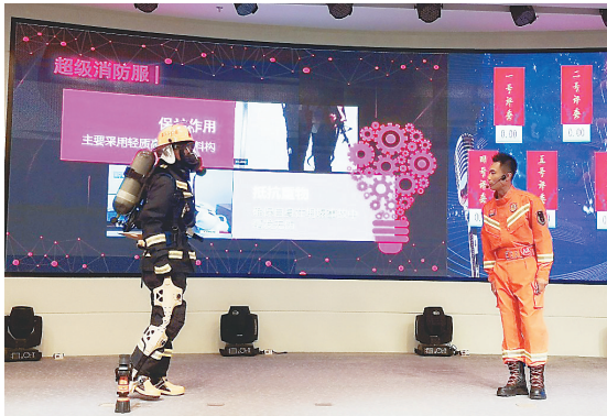
选手讲解超级消防服的设计原理。