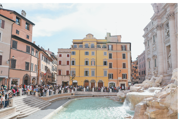
5月15日,游客在意大利首都罗马的许愿池前游览。意大利16日正式对部分国家的游客开放边境。

世界卫生组织16日公布的最新数据显示,全球累计新冠确诊病例达162177376例。截至欧洲中部时间16日15时02分(北京时间21时02分),全球确诊病例较前一日增加658585例,达到162177376例;死亡病例增加12034例,达到3364178例。