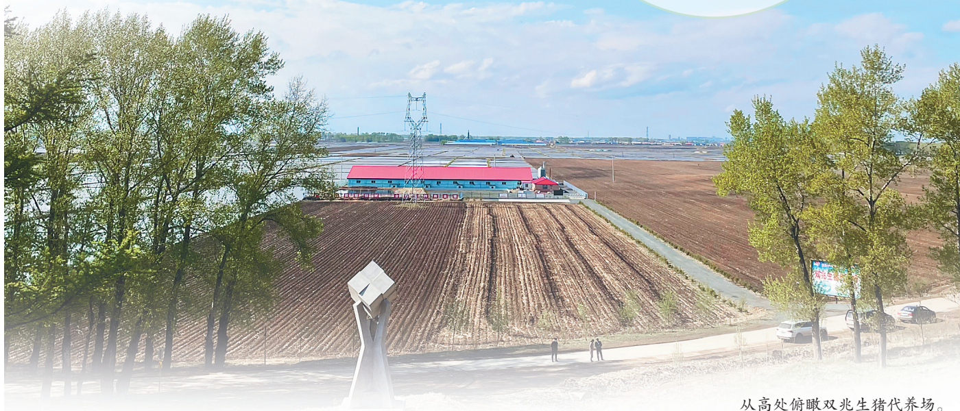
从高处俯瞰双兆生猪代养场。