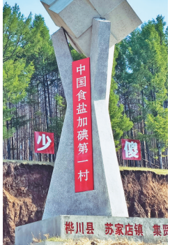
集贤村村口矗立的“中国食盐加碘第一村”的纪念碑。

5月15日是全国防治碘缺乏病日,记者走进了集贤村,实地感受这个昔日碘缺乏病村的新变化。