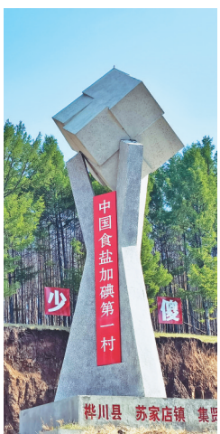
集贤村村口矗立的“中国食盐加碘第一村”的纪念碑。