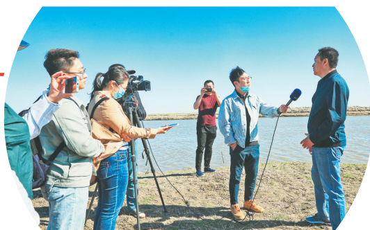
记者采访肇源县河湖治理。

本报17日讯(黑龙江日报全媒体记者张长虹)五月的龙江大地,草木萌发,春江潮涌。作为我省庆祝中国共产党成立100周年重要活动之一,“松花江上·百年印记”主题宣传活动17日启动。省委宣传部组织中央和省主要媒体记者一行奔赴大庆市肇源县,将从第二松花江和嫩江汇合处三岔河开始进行采访。为期近一个月的新闻媒体松花江之行就此拉开序幕。 松花江,龙国人的母亲河。松花江地处我国东北地区的北部,东西宽920公里,南北长1070公里,流域总面积56.12万平方公里。松花江有南北两源,北源嫩江流域面积29.85万平方公里,南源第二松花江流域面积7.34万平方公里,两江在三岔河汇合后称松花江干流,干流流域面积为18.93万平方公里。“我的家在东北松花江上,那里有森林煤矿,还有那漫山遍野的大豆高粱……”上个世纪30年代末,由著名作曲家张寒晖创作的歌曲《松花江上》在日寇大举侵华的紧要关头,唱出了“九一八”事变后东北民众乃至全国人民的悲愤情怀,这首歌在当时唤醒了民族之魂,点燃了中华大地的抗日烽火。在庆祝建党百年的今天,我们唱响新“松花江上”。一曲欢快的旋律,已成为龙江经济社会发展的见证。