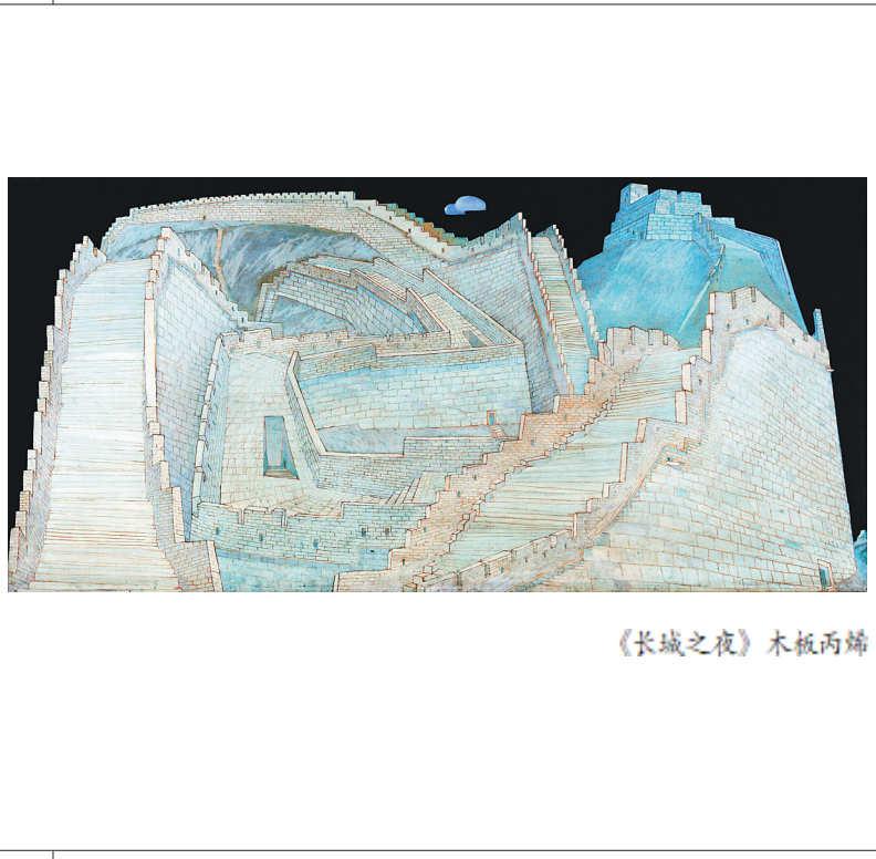
《长城之夜》木板丙烯