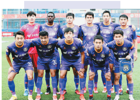
冰城队第5轮比赛首发阵容。