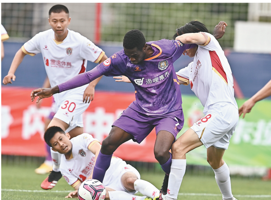
外援埃沃洛带给冰城队冲击力和激情。

随着尼扎木丁在16日进行的第5轮比赛中“读秒”绝杀辽宁沈阳城市队,黑龙江冰城队以一波遏止了两连败的三连胜,结束了本赛季中甲第一阶段第一循环的征程。