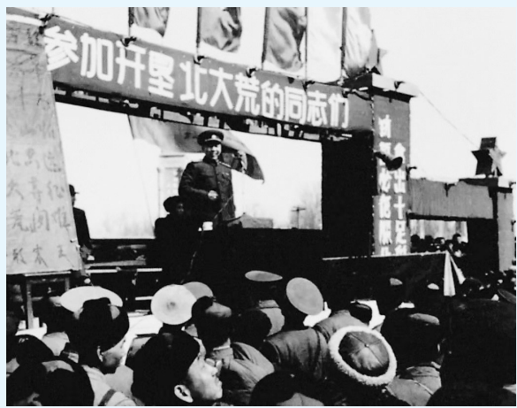
密山火车站大动员。

主编：施虹 责编：曹晖 (0451-84691037) 执编/版式：毕诗春 (0451-84655933) 美编：倪海连 投稿邮箱： hljrbssc@163.com