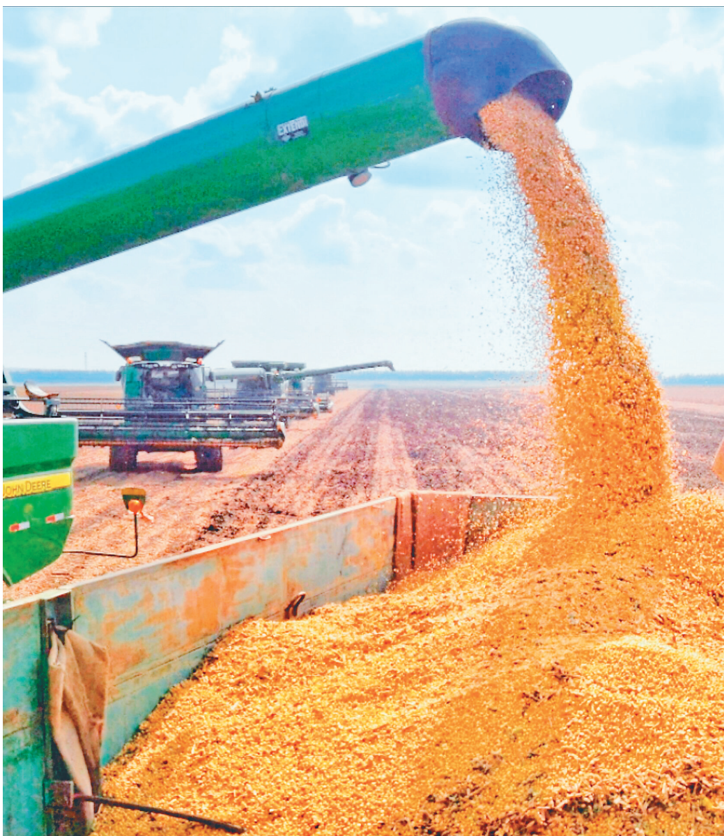
昔日的北大荒，今日的北大仓。

在完成播种面积7950亩后，经省政府同意，他们又于当年8月向牡丹江地区转移，场部暂住牡丹江市内，场名改为松江省机械农场，主力垦荒队进驻宁安县兰岗、石头一带，当年开荒两万多亩，同时接收了原县大队畜牧场和护路警察队垦荒点，并人耕地荒原一眼望不到边，地势低洼，不适合机械作业。最终也只能选择“第一犁”这样的原始木犁作业。