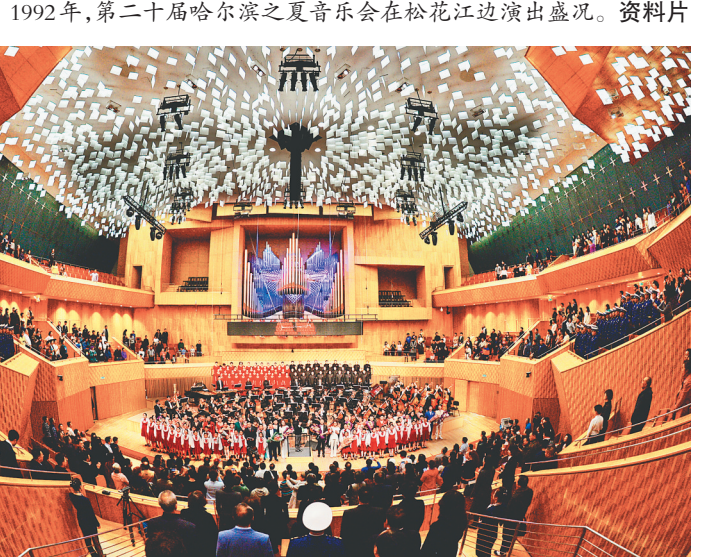
1992年，第二十届哈尔滨之夏音乐会在松花江岸边演出盛况。资料片

这是被联合国授予的“音乐之城”，走在街头巷尾，走进音乐殿堂，我们到处感受着流淌在城市深处的动人旋律。