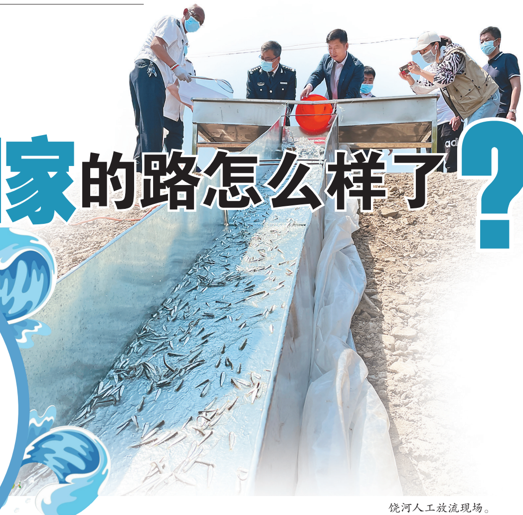
饶河人工放流现场。

黑龙江,是中国大马哈鱼的故乡。作为黑龙江省特有的鱼类种群,多年来,在各级政府和渔政部门、科学研究部门、民间组织NGO的共同努力下,大马哈鱼作为水资源生物多样性的一个标志性物种,在我省得到广泛关注。2016年12月,黑龙江日报曾以报纸整版篇幅做了《黑龙江,迎接大马哈鱼回家!》报道,呈现了大马哈鱼当时的生存状况,如今5年时间过去,大马哈鱼“回家”的路怎么样了?