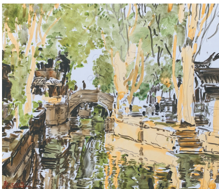
《古镇遗韵 No.8》 赵云龙