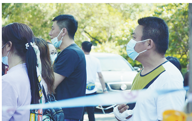
考场外,众多家长的陪考也同样令人动容。在哈尔滨市第一中学校门口,两位家长虽然因伤行动不便,却仍全程坚守。在哈尔滨市第四十九中学校门前,一位陪考家长靠在大树旁睡着了。