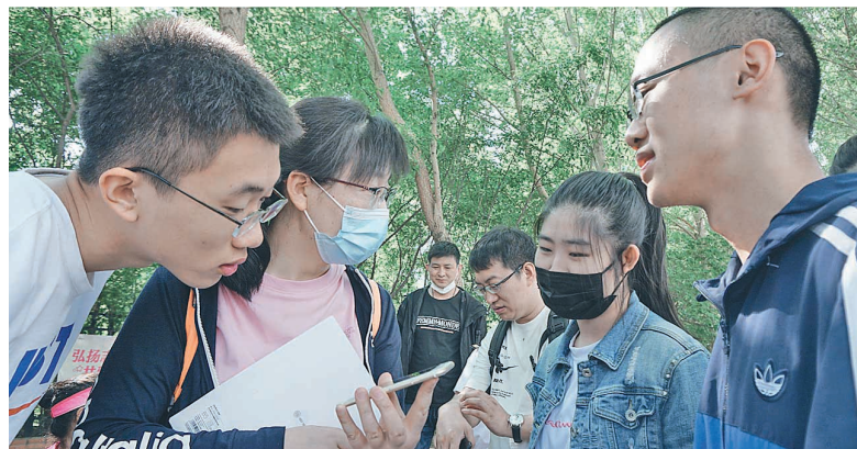
8日高考第二天,记者在哈尔滨师范大学附属中学考点外看到,老师们纷纷走到自己的学生身旁,或是一对一或是一对多,反复强调着知识点及注意事项,耳提面命上好“最后一课”。