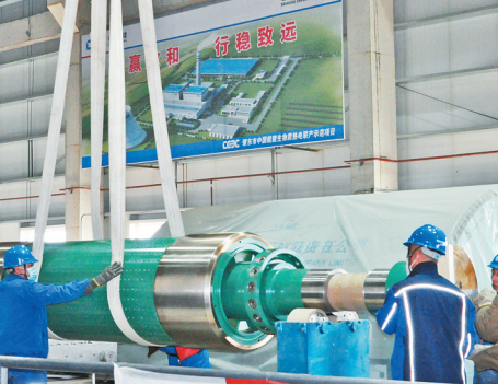
中能建肇东生物质热电项目安装现场。

如今,肇东市一座座现代化厂房拔地而起,一个个生产车间机器轰鸣,推动产业链由“短”变“长”,由“弱”变“强”。并运用“清单式交任务、链条式搞服务”和“倒排工期日调度”一线工作法,积极创造优良的营商环境,为企业培植最适合“繁衍”土壤,为项目“保驾护航”厚植创新创业创造新活力。