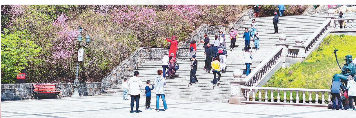
丰富的森林生态旅游资源吸引着八方来客