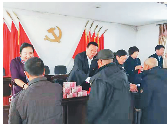
讷谟尔公司运用“保底收益+二次分红”模式,实现农民收益最大化。

黑龙江省农业农村厅副厅长李文德介绍,“十四五”是全面实施乡村振兴战略、加快农业农村现代化的关键时期。农业生产全程托管遵循了市场原则,在生产区域内整合各类农业资源提高了生产效率,促进了小农户与现代农业发展的有机衔接。同时,农业生产全程托管尊重农民土地承包权益,风险小、易复制推广,所以才能迅速在黑龙江遍地开花。特别是针对小农户和贫困户种地难题,我省还结合党史学习教育开展了深入田间地头为农民办实事活动,共组织了4700多家服务组织为27.7万个小农户提供了全程服务,其中服务贫困户2万多户。