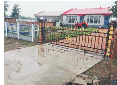
兰西县远大镇双太村村貌整洁一新。

兰西县有4个村股份经济合作社开展土地托管服务,其中远大镇双太村曾经是深度贫困村。如今通过农业生产全程托管,村集体经济越来越强。2019年、2020年村里每年收入60余万元,他们把钱用于村里建设上,修广场、建围栏、做绿化、装路灯、整排水……老百姓实实在在体会到了获得感和幸福感。