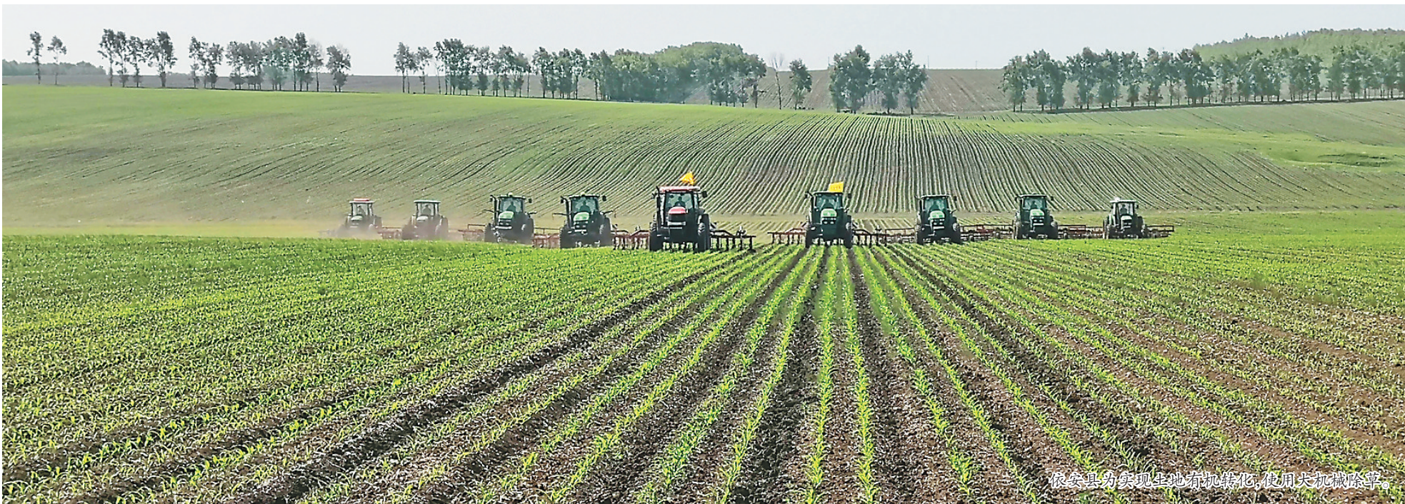
依安县实现机械化作业,使用无人机除草。

我省率先在全国开展全程农业生产托管服务整省推进,提升了新型主体联农带农能力,下一步如何加快转型升级,加速迈向农业现代化令人期待