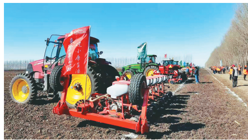
2021年绥化春耕启动会现场,农机整装待发。

就这样,农业生产托管成为构建现代农业经营体系的一大创新,成为把小农生产引入现代农业发展轨道的重要切口,进一步完善了农村基本经营制度,实现了生产要素的优化配置,提高了农业生产效率。