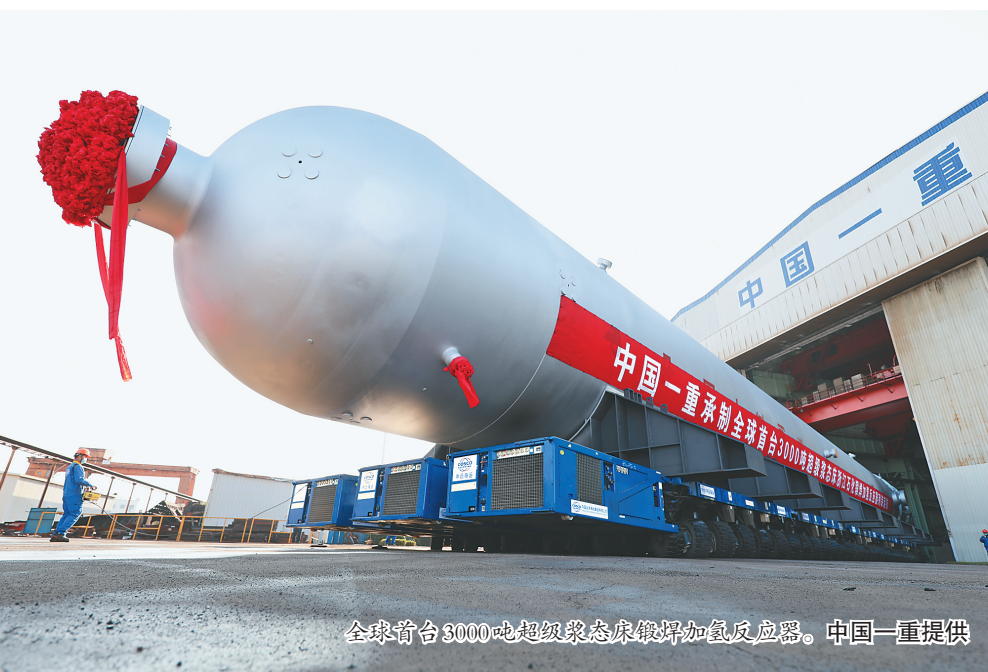
全球首台3000吨超超临界态床锻焊加氢反应器。

在展馆内,通过AI讲解推介、3D互动展品、VR全景影像、多媒体视频、图文展示等方式对参展企业和产品进行宣传推广。通过VR云展厅云直播入口,可以连接至指定平台的直播内容,观看大会相关直播。通过VR云展厅的云会议入口,可以链接至腾讯会议在线平台,供各展区客商在线推介及贸易洽谈。通过企业介绍或展品信息的在线交易入口,可以直接进入相关企业在线交易平台,进行在线产品交易。通过满满科技感的元素以及信息化、数字化手段助力我省贸易洽谈、招商引资。通过云展会,客商既可以全面了解展商信息,也能够精准锁定自己感兴趣的内容,提高双方的协商效率。