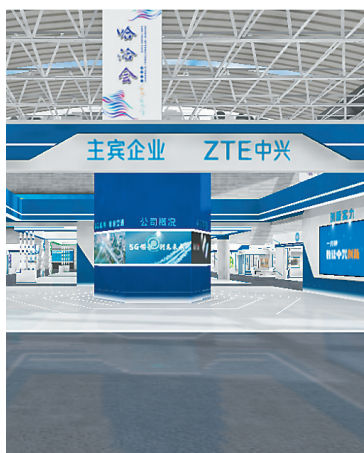
主宾企业中兴通讯的展区。云观展截图