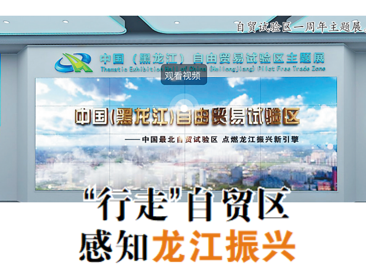
“行走”自贸区 感知龙江振兴

寒地黑土、绿色有机、非转基因是黑龙江农业发展亮丽的名片,龙江投资兴业的广阔前景和机遇,将为台商台企在大陆发展提供广阔舞台和更大空间。