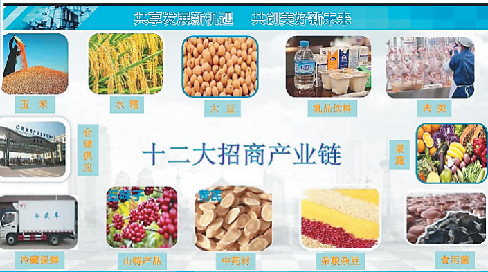
哈尔滨市十二大招商产业链。