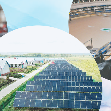
克东电网给百姓带来“阳光收益”。