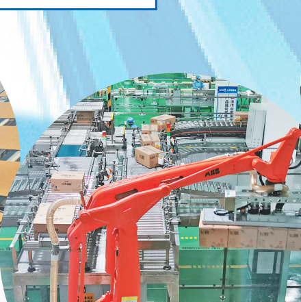
飞鹤5万吨智能化包装车间。