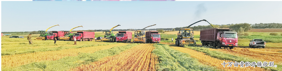
十方青农场开镰收割。