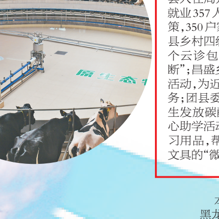
原生态牧场挤奶大厅。