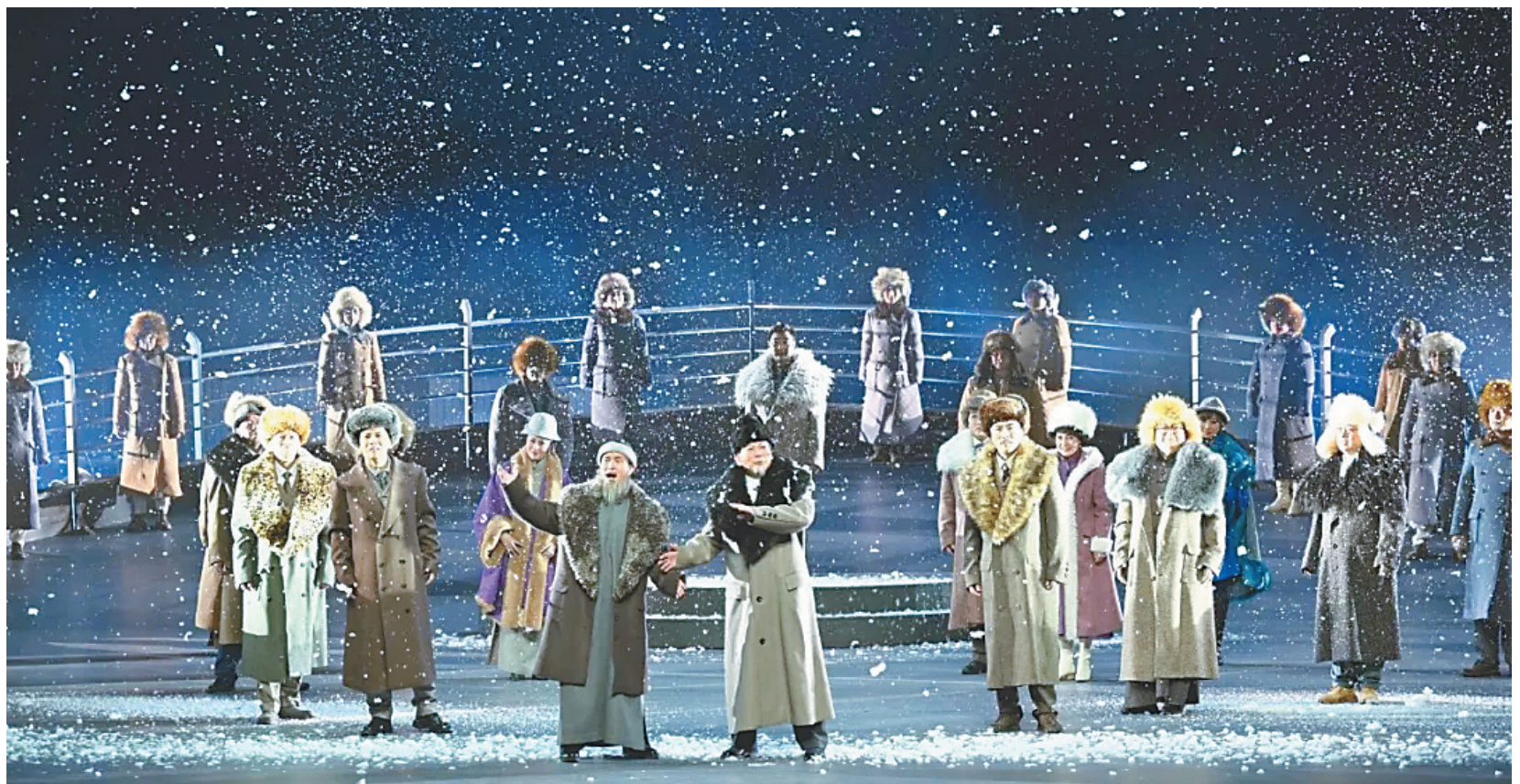
辽宁人民艺术剧院的话剧《北上》剧照。