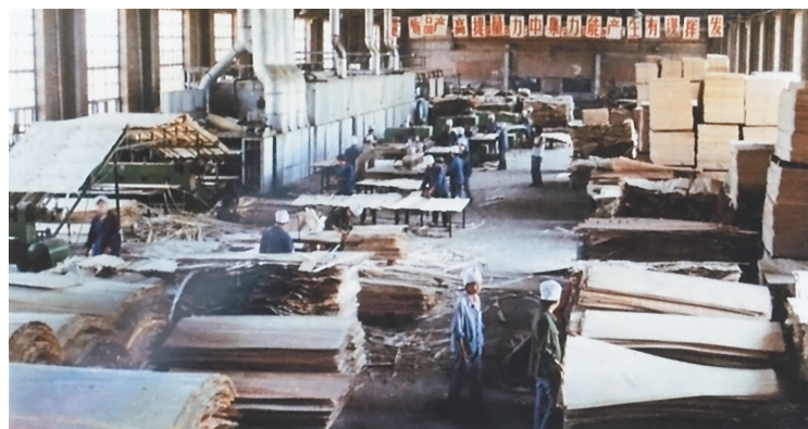
上世纪八十年代胶合板生产车间。

让职工群众获得感、安全感、幸福感不断增强,是龙江森工集团不懈追求的目标。2020年,龙江森工社会保障水平进一步提高,参加“五险一金”和城镇居民养老、医疗保险人数不断增加,覆盖面不断扩大;建设完成给排水、林区道路、防火公路等一批基础设施项目,林区生产生活条件持续改善,各林业局公司为职工群众增收探索出条条新路。目前,森工林区人均国内生产总值、人均纯收入等10个方面已达到全面建成小康社会标准,全体森工人的小康梦,圆了。