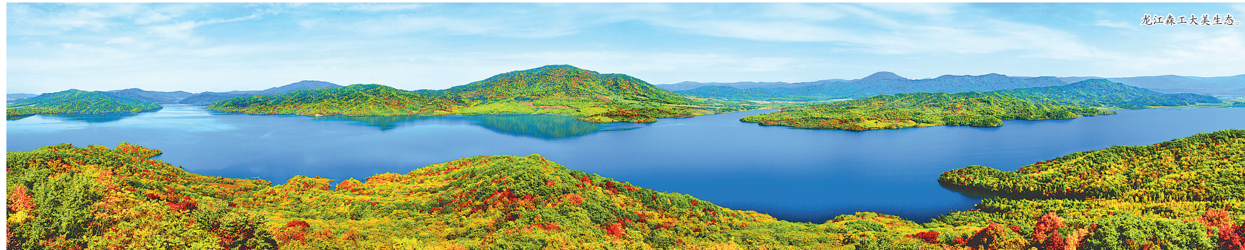
龙江森工大美生态。