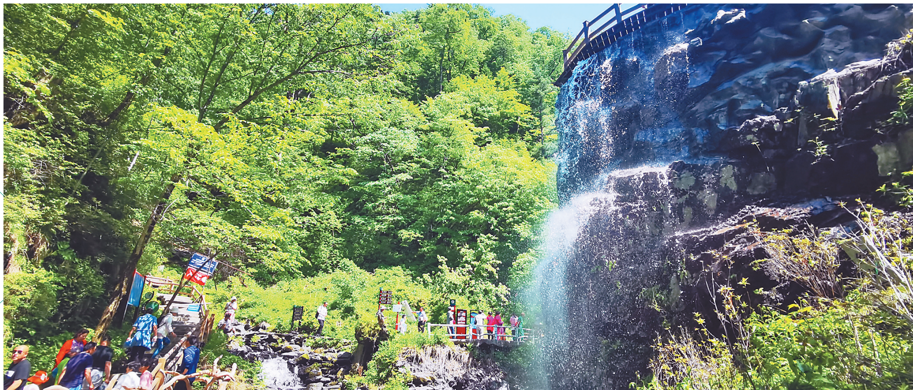
凤凰山旅游成为龙江森工靓丽名片。

1946 年,大森林回到了 人民手中; 新中国成立 立,大批开发建设者挺 进亘古荒原、莽莽森林,战 天斗地,爬冰卧雪; 上世纪80年 代 ,积极调整产业结构成功摆脱“两 危”; 2014年 ,全面停止商业性采伐; 2018年6月30日 ,龙江森工集团挂牌…… 回首波澜壮阔的奋斗史,龙江森工,这个共和国 森林工业的骄子,始终如一,艰苦奋斗,发展 大森工、建设大林业、保护大生态…… 奋进新时代,逐梦新征程。勇毅 果敢的森工人,在深化改革中勇 当先行者,在抗击疫情中勇 当逆行者,在产业发展中勇 当探索者,在生态建设 中勇当守护者,以 更加优异的成 绩献礼建党 100周 年。