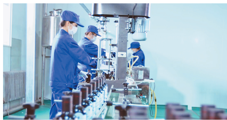
现代化的紫苏油生产线。