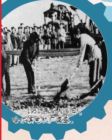
1951年3月3日,哈尔滨电机厂奠基。

黑龙江,被称作老工业基地。在共和国的工业史上一定会有黑龙江人的姓名。 建国初期,25家大企业北迁,国家“一五”时期156个重大项目中22个落在黑龙江。这片黑土地上诞生了中国第一个电力发电设备企业——哈电集团、第一座重型机械厂——中国一重等“共和国长子”。 还有王进喜、王启民为代表的几代大庆工人发出的:“有条件要上,没有条件创造条件也要上!”在这振聋发聩的誓言中,孕育了伟大的大庆精神、铁人精神。大庆成为全国工业战线的一面旗帜。