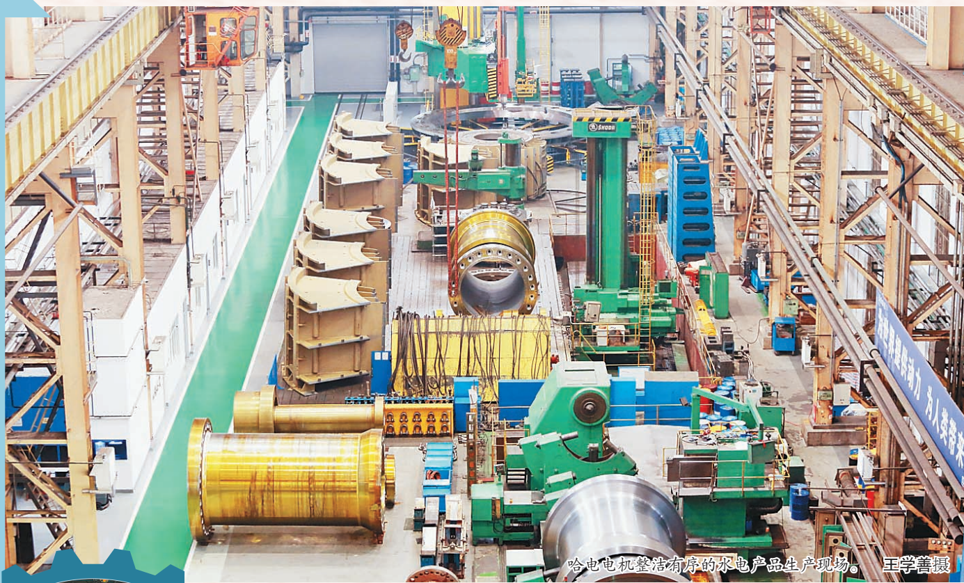
哈电电机整洁有序的机电产品生产现场。