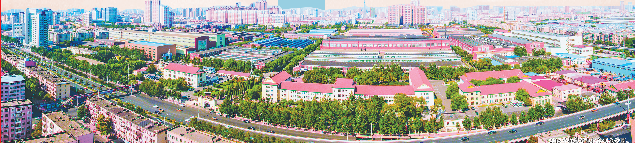
2015年拍摄的电机公司全景图。