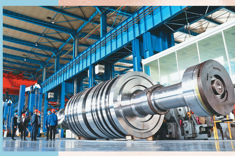
中国一重独立研制百万千瓦整锻低压转子成品,攻克“卡脖子”关键技术实现国产化。