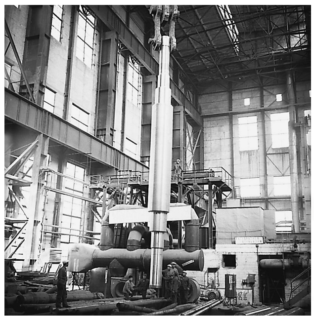
1965年12月,10万千瓦汽轮机转子在一重研制完成。