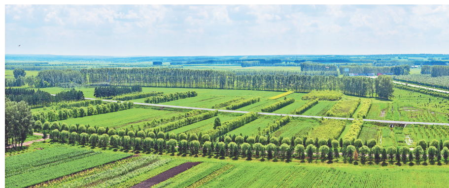
绿色有机食品生产基地。