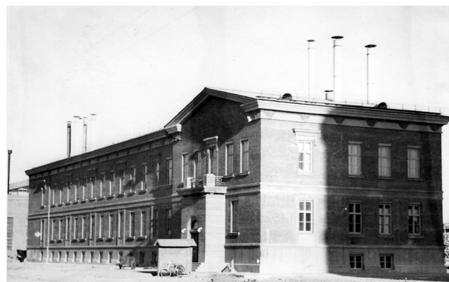
原北钢技术质量部。