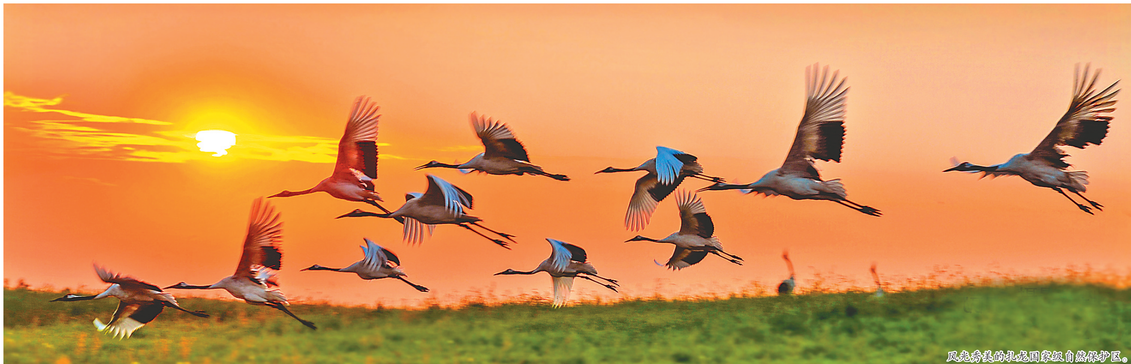
风光秀美的扎龙国家级自然保护区。

当百年历史的时空线交汇在北纬47度线上,齐齐哈尔——松嫩平原上的明珠,美丽的鹤城,在经历百年风雨后,正生机勃勃,承载着辉煌与使命,书写着奋进新时代的绚丽华章。