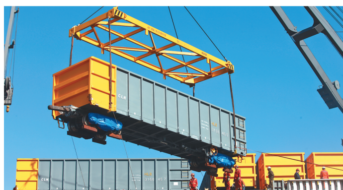
中车齐车出口澳大利亚铁矿石车发运港口。

推动12个重点产业建设,深入实施“百万千”产业倍增计划,建设装备制造、食品加工、生物医药和新能源4个“千字号”产业集群,建成国家精密超精密制造基地、国家原料药基地、国家高端猪肉产业基地、国家中央厨房加工基地,奋力扛起工业强省、农业强省两面大旗,打造老工业基地转型升级的全国样板。