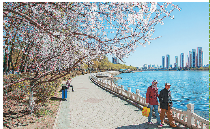
美丽的劳动湖成为市民休闲好去处。