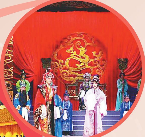
京剧《奇女无容》演出现场。