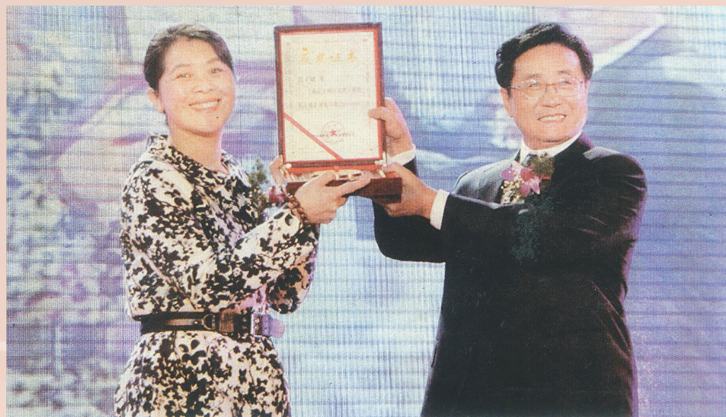
作家迟子建获第七届茅盾文学奖。

黑龙江悠久的历史孕育了独特的地域文化。黑龙江各族人民在漫长的生产实践中,不断创造了具有黑土文化特色、民族特色的各种文学艺术作品。新中国成立后,贯彻党的“百花齐放,百家争鸣”的方针,提倡文艺创作独创性,提倡风格多样化,发展不同艺术流派,促进了文学艺术的发展。全省从城市到乡村普遍建立了群众艺术馆、文化馆、俱乐部,群众性的文化活动得到迅速发展。龙江剧、二人转、评剧、京剧、话剧、歌剧等各种剧目演出不断,深受广大人民群众喜爱。