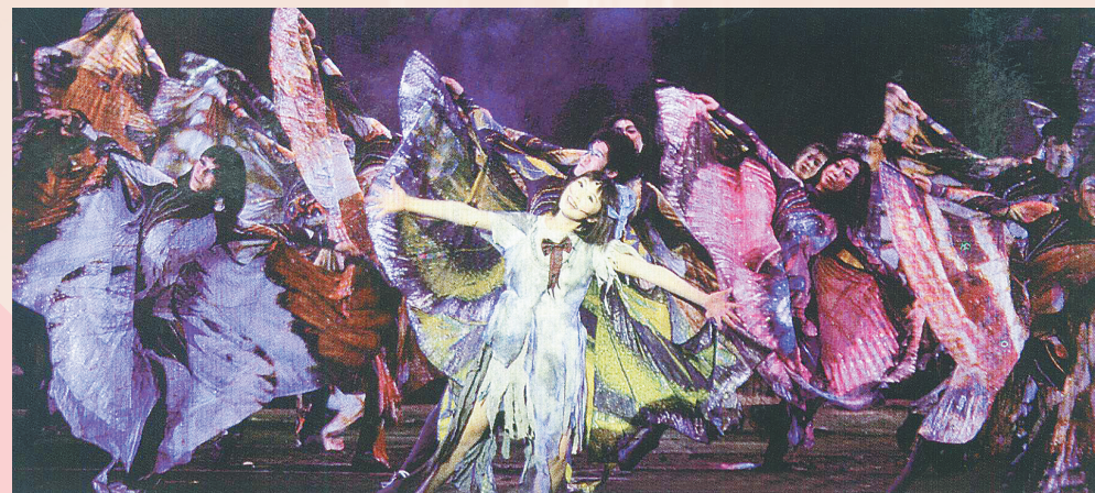
历时四年打造的中国原创音乐剧《蝶》在全国巡演近百场,并获得国际音乐节特别奖。

之于一个地域,文化如浩瀚苍穹中的点点繁星。牛郎星、织女星、天狼星……星星闪耀,赋予了黑龙江,这座北国边陲之省以更多文艺之韵,律动之美。 和地域有关,黑龙江的文化有着自己的底蕴和传统,因而散发出独特的光彩与魅力。 她,是摩登而洋气的。在这里,诞生了中国最早的交响乐团和芭蕾舞剧团。西洋文化最早在哈尔滨这座城市绽放出了她的光彩。 她,是深沉而厚重的。从十几万年前的黑龙江发祥地到灿烂的金源文化,从东北作家群到知青文化,从中国最早的交响乐团到“黑龙江戏剧现象”,深深植根于黑土地的黑龙江文化艺术显示出勃勃生机。 文艺舞台,星光璀璨。我省先后有17人18次获得中国戏剧梅花奖,14个剧目获文华奖,14个剧目获得中宣部“五个一工程”奖。戏曲、歌舞、曲艺、杂技等艺术门类协调发展,成绩卓著。 她,是热情而蓬勃的。随着日子“越来越好”,人们于快乐而诗意的追求亦越来越强。110个公共图书馆,150个群众艺术馆(文化馆),160多家国有博物馆,8000多个村级综合性文化服务中心,1280个街道(乡镇)文化站,20000余个文化大院,以及“哈夏音乐会”等丰富多彩的高品质文化活动,让更多人的文艺之心找到憩息之所。 在连续两届中国艺术节上,我省群众队伍原创作品《一定要找到你》、《红高粱》荣获了全国文