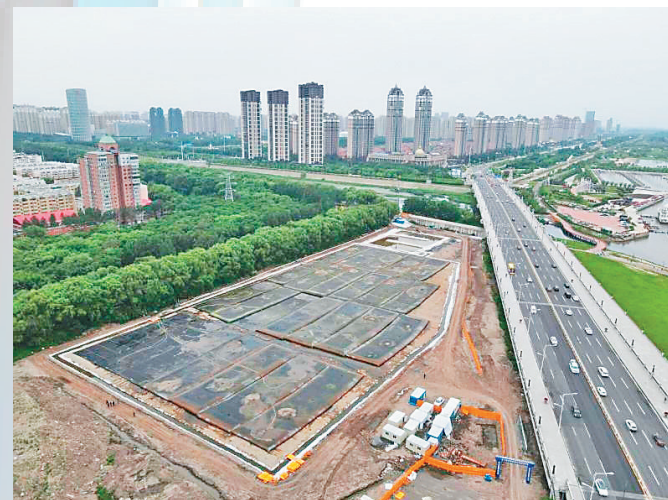
何家沟清淤工程改善水环境质量。