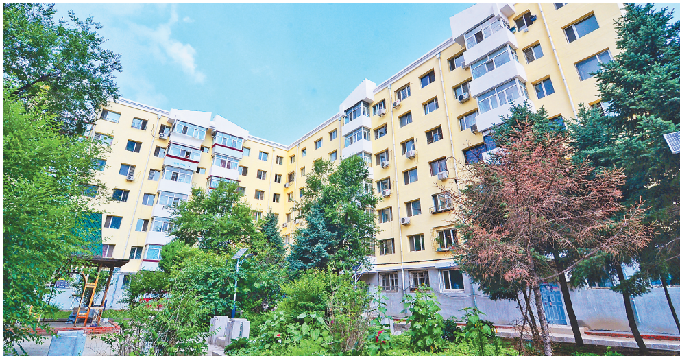
老旧小区改造让百姓生活更美好。

截至6月10日,哈市南岗区和平房区150.89万平方米改造工程已全部开工。据了解,道里区、道外区、香坊区共开工164.83万平方米,松北区、呼兰区、阿城区全部开工。