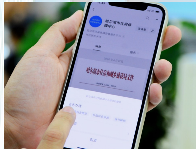
市民足不出户即可缴纳公租房租金。