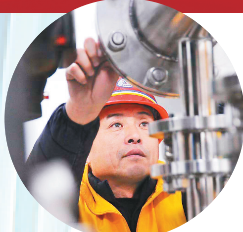
二次供水改造让老旧小区居民告别“吃水难”。

针对生活困难、身体残疾、难以到窗口办理公租房租赁补贴手续和缴纳租金的公租房户,哈尔滨市住建局急群众之所急、解群众之所难,创新研发了哈尔滨市住房保障微信公众号,公租房户足不出户、仅用一部手机或一台电脑,即可办理公租房租赁补贴和公租房租金缴纳,真正做到了让“信息多跑腿,群众少走路”。 此外,针对查询新建商品房网签合同备案信息需由本人到窗口查询,费时、费力而且不便的问题,哈市住建局创新推出了手机移动端公众号线上查询方式,让广大群众足不出户、轻松动动指尖,就能查询到商品房信息。 针对小区物业企业不作为,业主面临投诉难、服务质量监管难等问题,哈市住建局创新研发了哈尔滨市“智慧物业”管理信息系统,全市住宅小区广大业主可通过“哈尔滨住建”微信公众号,对物业服务中存在的问题进行投诉,投诉内容逐级转交社区、街道办、区物业办等部门限期处理,业主还可通过“哈尔滨住建”微信公众号,对小区物业服务满意度和业委会满意度每月测评打分一次。与此同时,“智慧物业”中的哈尔滨市物业服务企业信用评价板块也同期上线,该板块主要面向市物业主管部门、区县物业主管部门、街道办事处、社区居民委员会、物业管理协会等开放端口,采集企业相关信用信息,实施信用综合评价,依法依规公开企业信用记录和评价结果,进而提升物业服务品质。