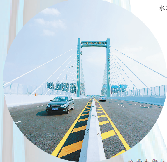
哈西大街打通工程贯通哈西地区与二环路连接。