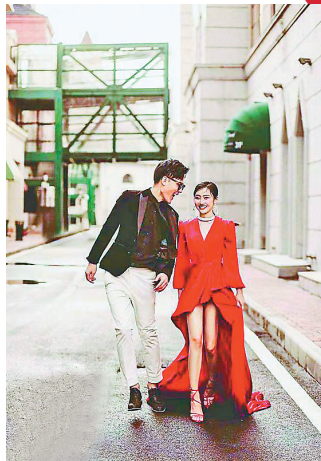
松北区世界欢乐城。