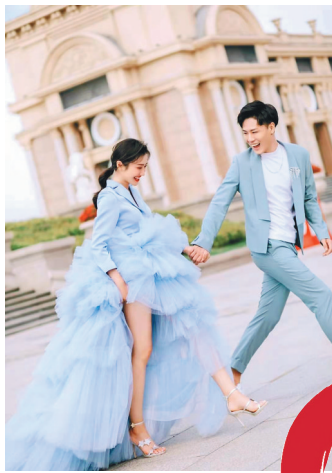
群力新区音乐广场。

冰城夏都哈尔滨当下正逢婚礼季，婚纱照作为婚礼筹备的重要环节，该去哪里拍呢？传统的太阳岛、索菲亚教堂仍是不少新人的选择，但作为终身大事，也有不少新人希望选择一些与众不同的新景色，作为自己婚纱照的独特背景，于是一批新的“外景地”脱颖而出，成为新的婚纱照打卡地。