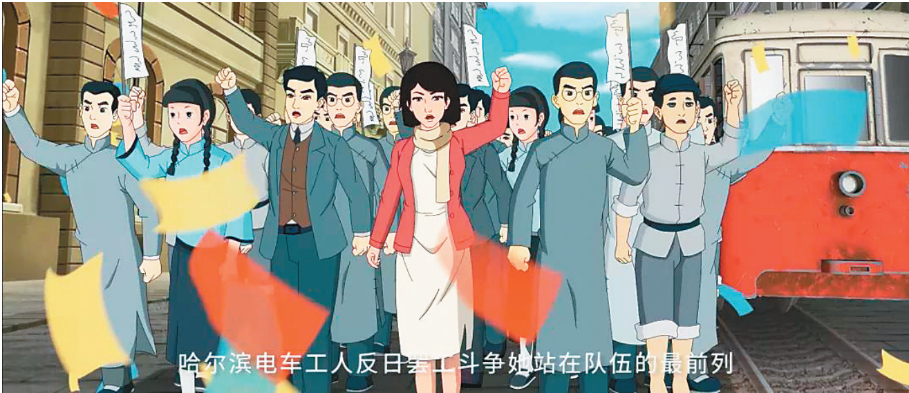
哈尔滨电车工人反日罢工斗争她站在队伍的最前列