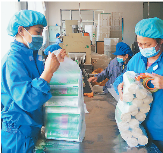
驰宇公司的工人们正在紧张忙碌着。

在晴川饲料加工厂内,卜经理高兴地说,场内运营设备已安装完毕,等待原料到位后即开始生产。