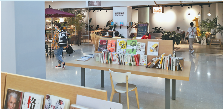
市民在书店内边读书边纳凉。

伏天还有哪些养生小妙招?黄秋贤建议,在这个时节要注意增加营养,食物以清淡易消化为宜,少吃油腻和辛辣的食物,要做好心理调节,静心安神,戒躁息怒。同时户外活动应注意避开太阳照射,可选择在清晨、晚间气温降低时运动,避免晒伤或中暑,要多喝水并保持睡眠充足。