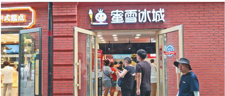
异常热门的冷饮店。