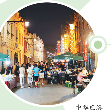
中华巴洛克游人很多。