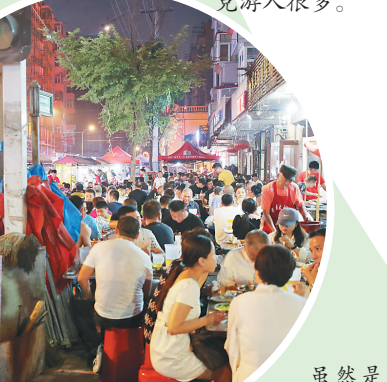
虽然是晚上9点,但附近餐馆顾客依然很多。