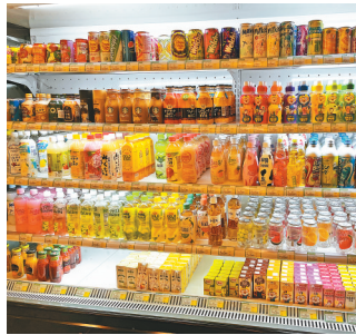
琳琅满目的冰镇饮品备受市民青睐。