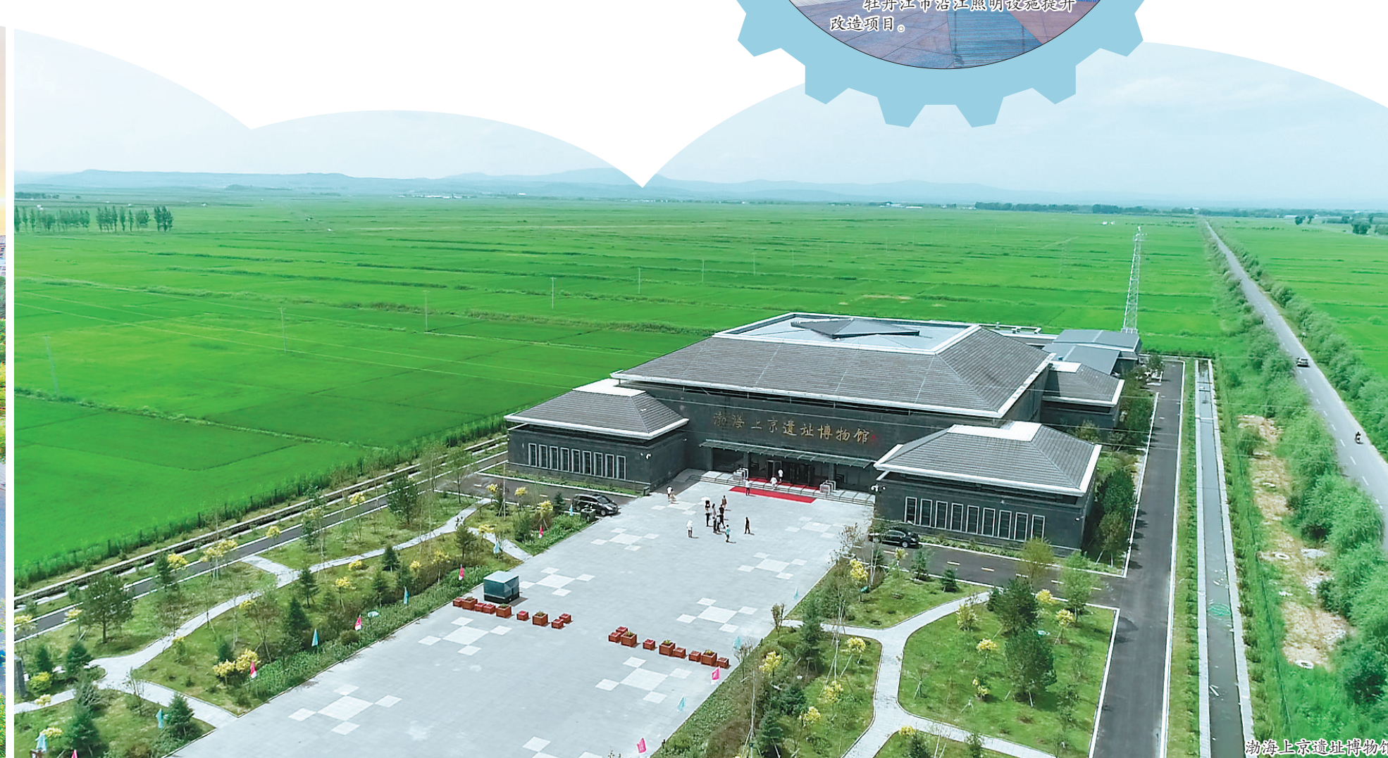
渤海国上京龙泉府遗址公园。