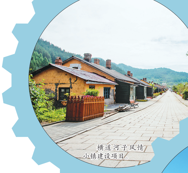
横道河子风情小镇建设项目。