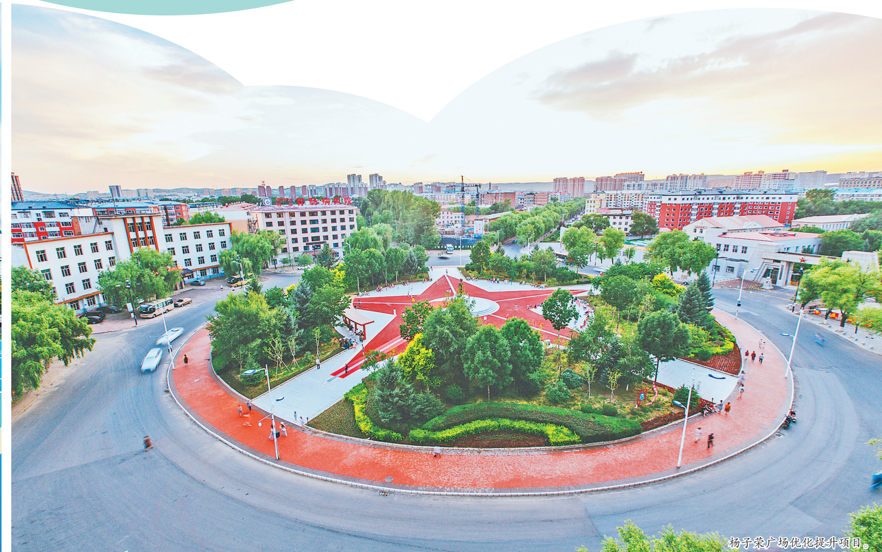
启明广场优化提升项目。