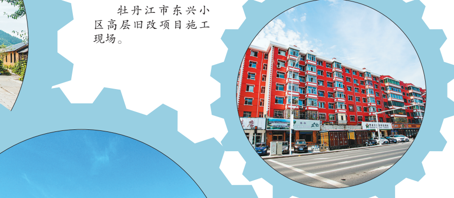
老旧小区楼本体及配套基础设施改造建设项目。