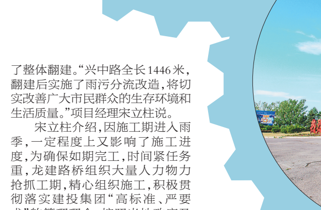
牡丹江市区环境基础设施提升改造项目。