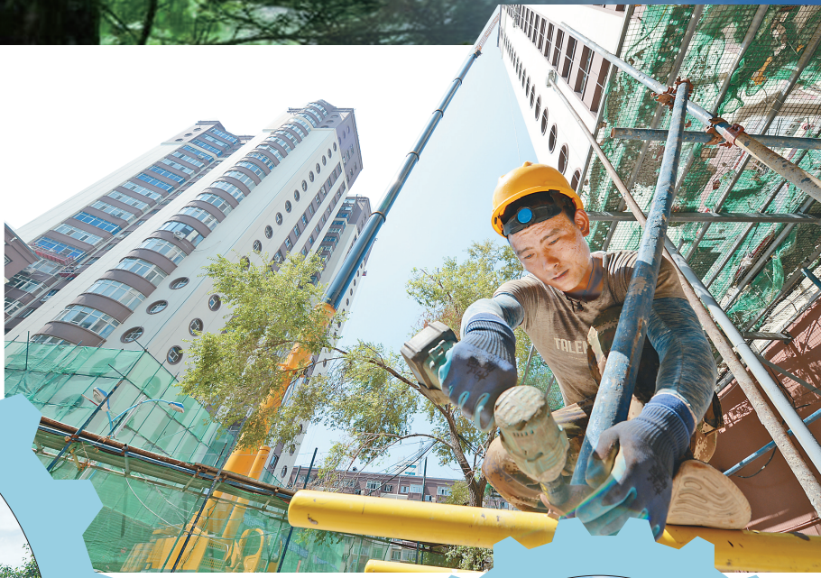
牡丹江市东兴小区高层旧改项目施工现场。

“此次高层老旧小区改造项目，我们秉持美好环境与幸福生活共同缔造的理念，有效改善了老旧小区居民居住条件，增强了群众获得感、幸福感和安全感，同时还积累了高层旧改的成熟经验。”房建说。