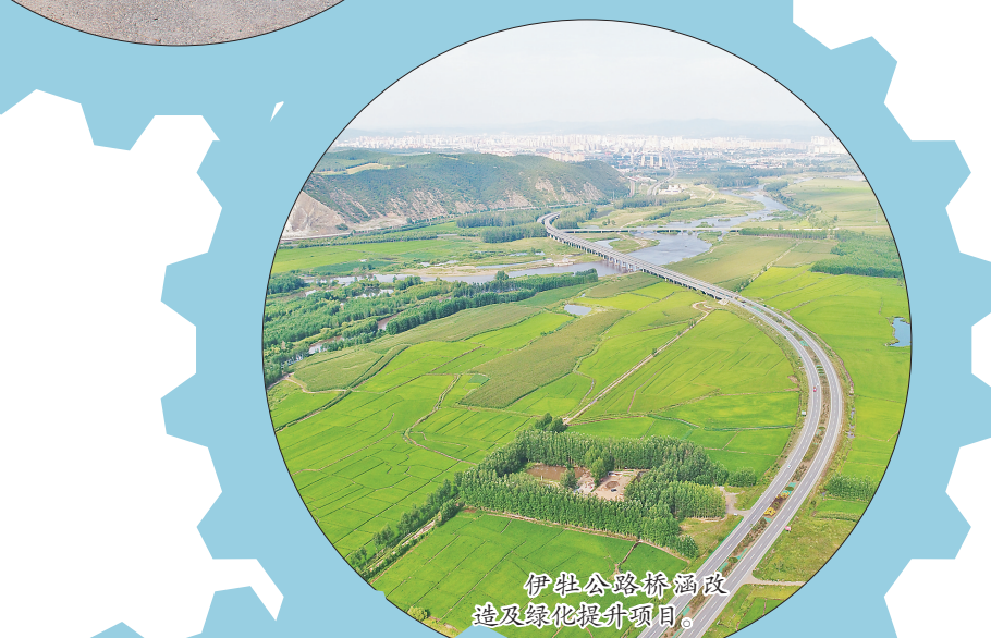
伊健公路桥涵改造及绿化提升项目。