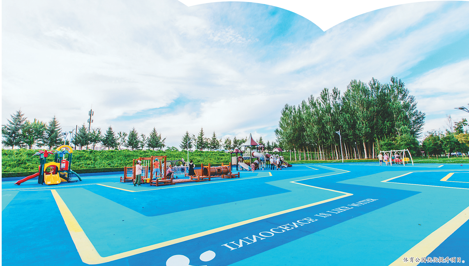
体育公园优化提升项目。