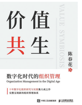
《价值共生 数字化时代的组织管理》 陈春花/人民邮电出版社/2021-5

在真实世界中，几乎所有的决策都存在信息不对称问题。现代经济学主要有两大功能，一是解决信息不对称下的激励问题，二是寻找数据背后的因果关系。契约理论把所有的人与人之间的关系看作是一种契约关系，然后通过设计各种机制和制度，来解决契约失灵问题。这本书就是要给大家提供一个理论分析框架，从信息不对称的角度来解释这个不完美的世界，并且帮助大家做出最优决策。