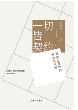
《一切契约》 袁辉华/上海三联书店/2021-5

在真实世界中，几乎所有的决策都存在信息不对称问题。现代经济学主要有两大功能，一是解决信息不对称下的激励问题，二是寻找数据背后的因果关系。契约理论把所有的人与人之间的关系看作是一种契约关系，然后通过设计各种机制和制度，来解决契约失灵问题。这本书就是要给大家提供一个理论分析框架，从信息不对称的角度来解释这个不完美的世界，并且帮助大家做出最优决策。