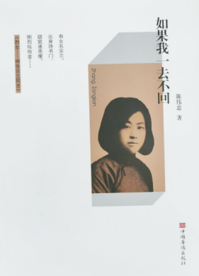
2020-8 中国华侨出版社 《如果我一去不回》 陈伟忠

被出租和外借。而在《极简主义·健康》一章中，我们为读者介绍了很多好用的磨砂膏、香体止汗剂以及牙粉的DIY配方。它们制作起来十分简单，只需少量的材料，即使是不擅长手工制作的人也可以轻松完成。同时，本书还讲述了莉娜·格林和她的家人在自己的小菜园中种植时令水果、蔬菜的故事，还介绍了两位极简主义者自创的“一锅”食谱。在《极简主义·生活方式》一章中，读者可以深入了解西亚和苏汉诺“零垃圾”的日常生活方式——他们每年产生的垃圾都装在一个玻璃瓶里。极简主义不是非黑即白的教条，而是一种多姿多彩、具有生命力的生活理念。读者完全可以采用那些足以说服自己、让自己产生共鸣的建议，以快乐的方式尝试极简生活。希望书中提出的概念和观点能够推动读者思考、尝试，并最终确立一个目标：简约地生活。我们生活在一个物质极度丰富且充满刺激的世界里，有些物品我们每天都在使用，有些给我们带来很多快乐。但几乎每个人都在家里发现过自己明明拥有却完全不记得的东西，在这些东西乱成一团，还没有被