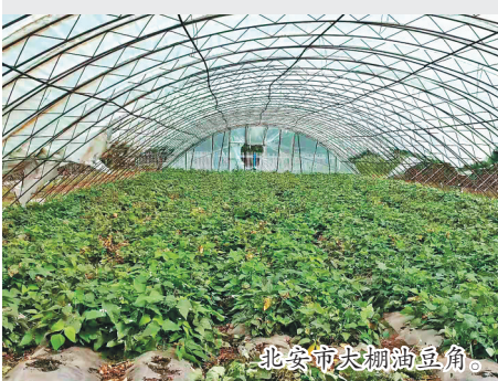
北安市大棚油豆角。

随着时间的流逝,油豆角成为生活在这片黑土地上的龙江人最割舍不掉的乡愁。北大荒的屯垦官兵、下乡的知识青年,在他们的迁徙中,油豆角也被带到了祖国各地。尤其随着北菜在全国的推广,油豆角当仁不让地成为了东北菜的头牌,逐渐受到全国消费者的追捧。