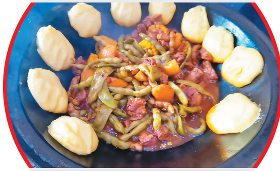
油豆角是东北特色铁锅炖必不可少的食材。