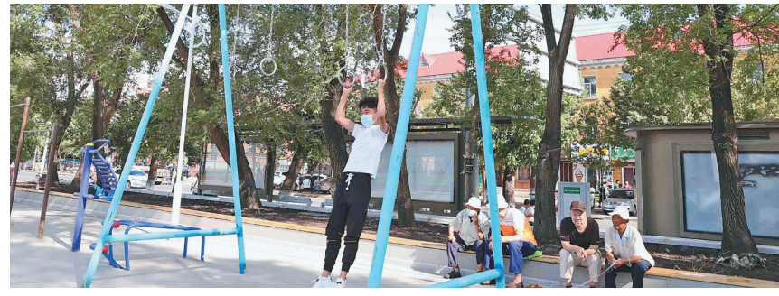
哈飞运动休闲广场上市民在健身。