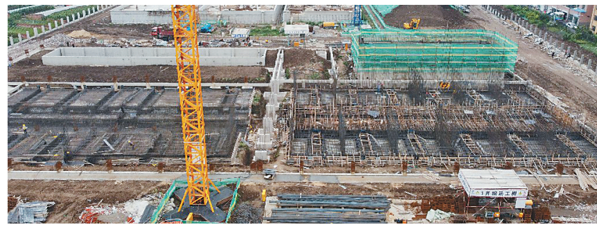
日产能5万吨的自来水厂建设工程现场。