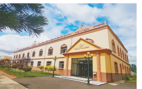
富锦市东部水厂厂区一角。

富锦市致力于推进花园式水厂建设、水质升级改造工程、智慧水务工程、管网清洗工程等工作,利用信息技术实现提升管理和服务质量,全方位保障人民群众饮水安全。