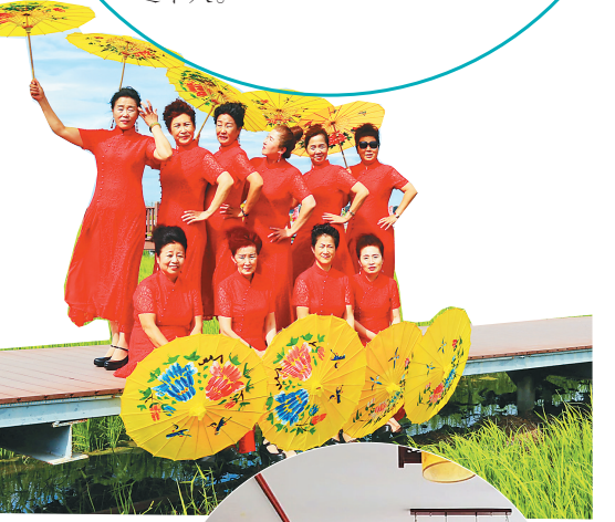
↑游客在水稻公园休闲娱乐。

通过打造“生态+农业+文化+旅游”发展模式,全力推动旅游及相关产业融合发展,把资源优势转化为经济优势、产业优势。着力在吃、住、行、游、购、娱六个方面进行旅游产品优化、核心资源强化、游客感观体验提升,努力实现全域融合、全民共享的旅游生态圈,把全域旅游提档升级作为重中之重。富锦大湿地、大平原、大农业、大粮仓、大产业的知名度和影响力持续扩大。年初以来,富锦市旅游业接待游客累计23万人次,旅游综合收入逾3600万元,旅游产业正逐步成为富锦经济发展的新增长极。