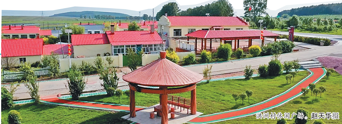
洪洲村休闲广场。