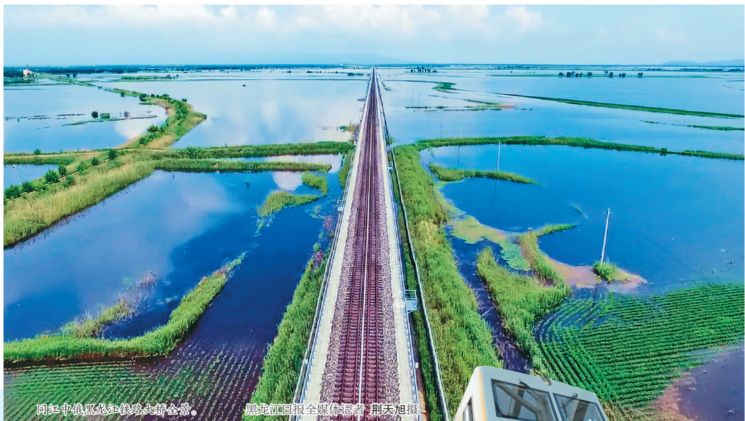
同江中俄黑龙江铁路大桥全景。

本报17日讯(黑龙江日报全媒体记者狄婕)黑龙江日报全媒体见习记者王迪)17日9时58分,在同江中俄黑龙江铁路大桥施工现场,中俄两国准轨接口最后一组轨道夹板安装完成,标志着中俄两国首座跨江铁路大桥——同江中俄黑龙江铁路大桥实现铺轨贯通,为大桥全线开通运营奠定了坚实基础。