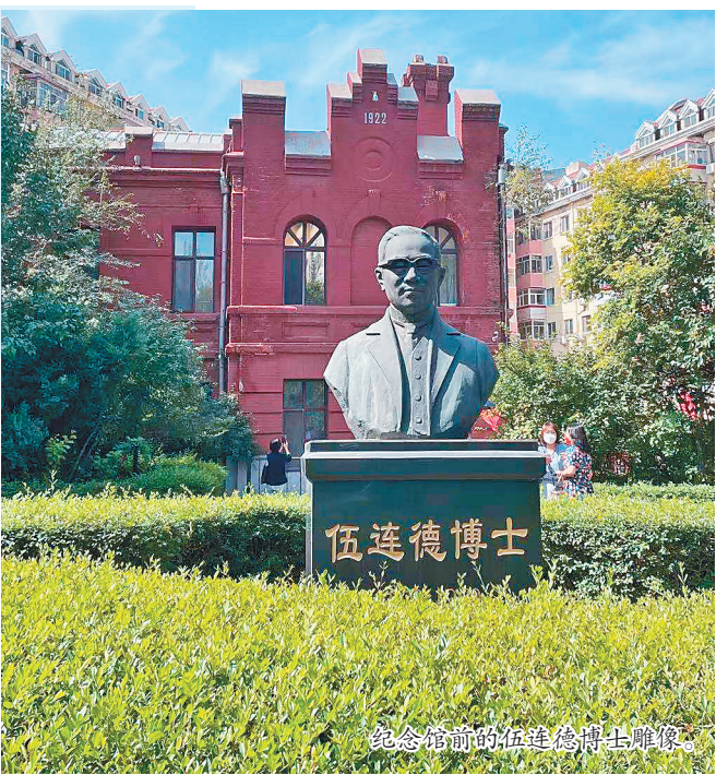
纪念馆前的伍连德博士雕像