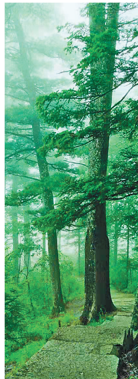
伊春五营国家森林公园。