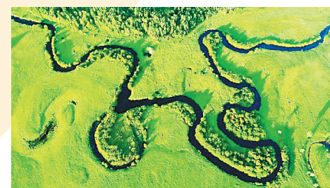
大兴安岭嫩江源景区。

连续三届的旅发大会实践证明，大会已成为国内外旅游业界交流合作、共赢共享的有效平台；展示龙江文旅形象、经济社会发展成就的重要窗口。通过高标定位、系统推进、放大效应，旅发大会有效推进了我省全域旅游建设和旅游高质量发展，进一步叫响了“北国好风光，尽在黑龙江”品牌，正有力助推龙江“旅游强省”建设。