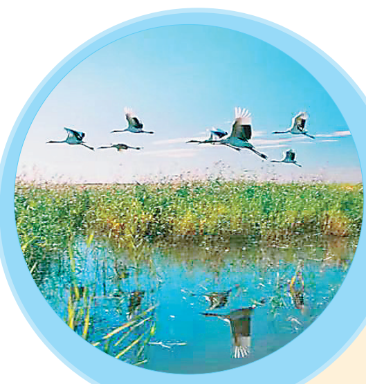
齐齐哈尔扎龙国家级自然保护区。