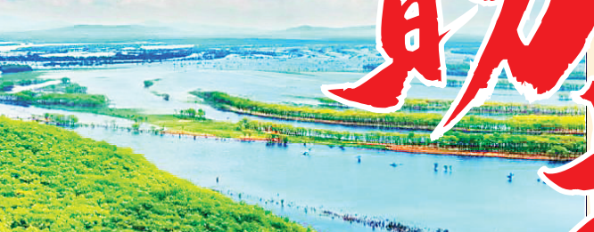
鸡西东方红湿地自然保护区。