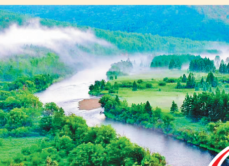
大兴安岭九曲十八弯湿地公园。