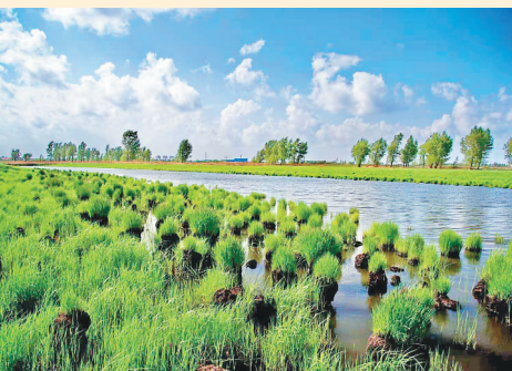
哈尔滨太阳岛外滩湿地。