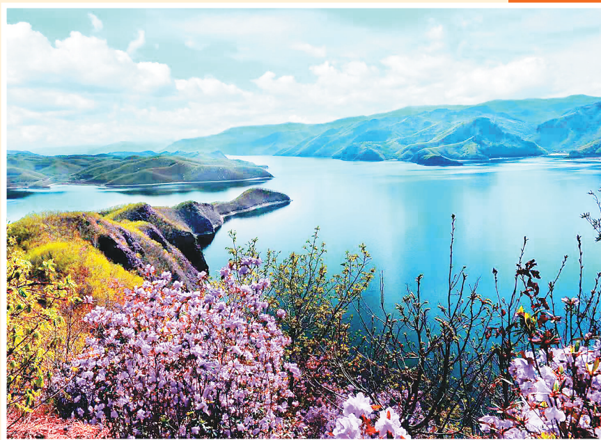
牡丹江莲花湖风景名胜区。