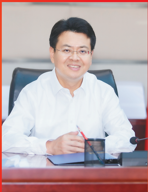
中共大庆市委书记 李世峰