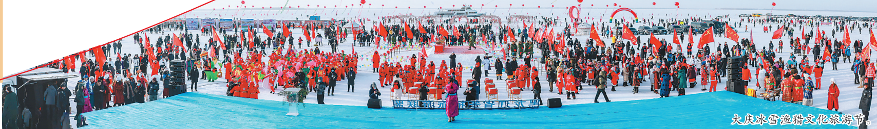
大庆冰雪渔猎文化旅游节。