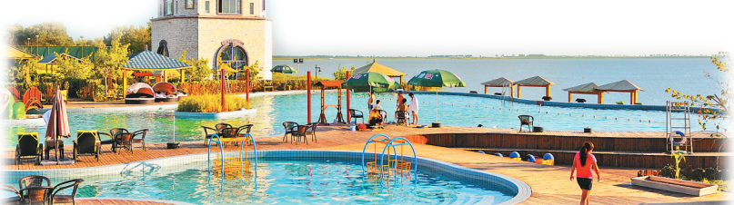
大庆连环湖温泉景区。