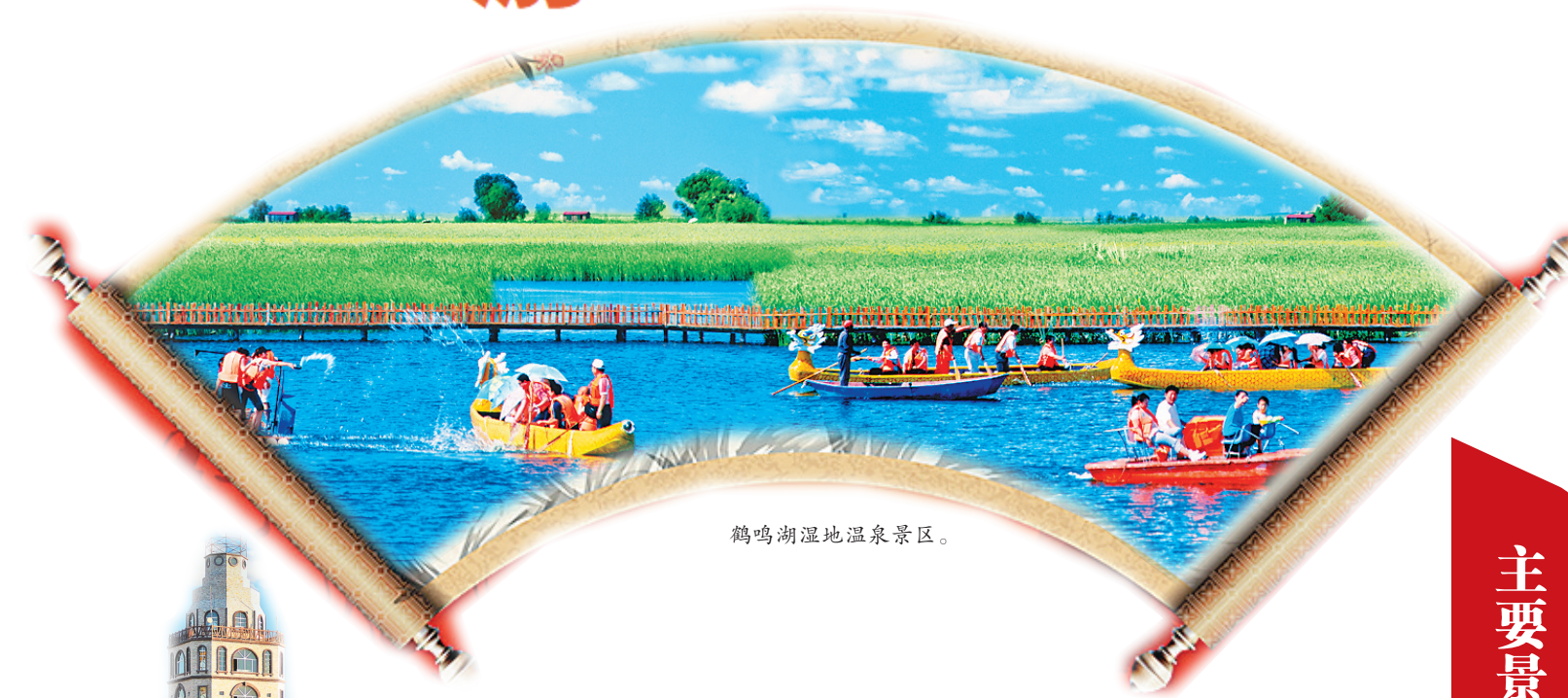
鹤鸣湖湿地温泉景区。