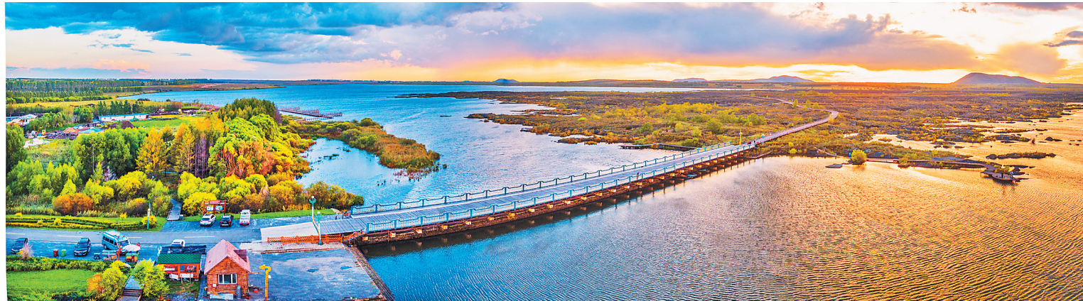
国家5A级旅游景区——五大连池风景区。