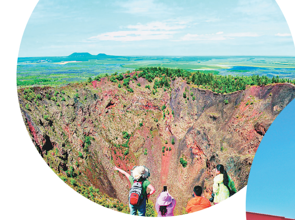
中国最年轻的火山——五大连池风景区老黑山。