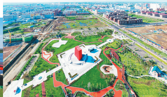
瑷珲—腾冲中国人口地理分界线主题公园。