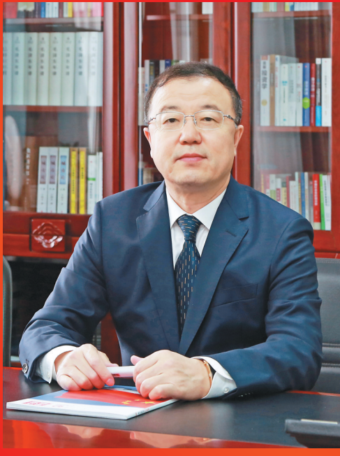
中共黑河市委书记 马 里