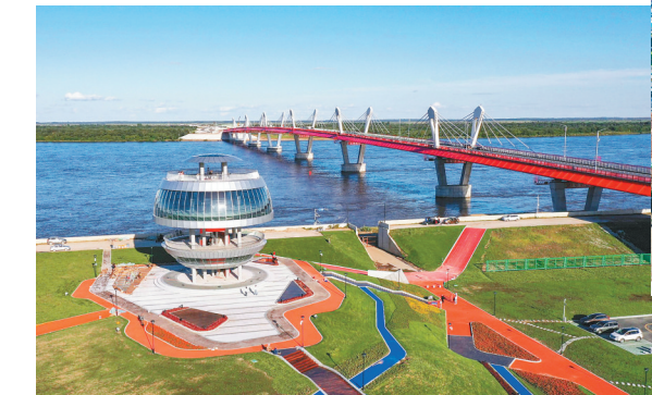
黑龙江大桥公园及观光塔。