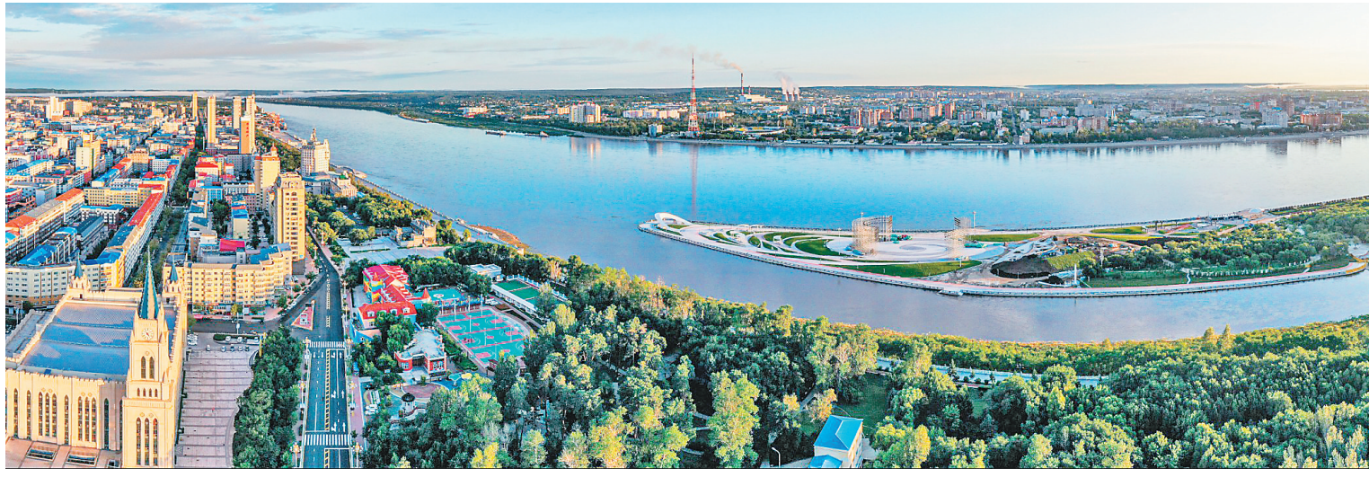
黑河与俄罗斯阿穆尔州首府布拉戈维申斯克市隔江相望。

黑河地处黑龙江省北部,是我国首批沿边开放城市、中国优秀旅游城市、国家卫生城、国家园林城、中国十佳魅力城市。